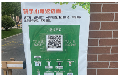
滨海新区泰达街道香柏园小区门口张贴着“骑码进门”App的宣传海报。

我市已经关注到骑手进小区因为超速等带来的一些安全隐患,也在试点采取科技等手段规范管理。比如滨海新区为进一步规范小区内部秩序,保障居民安全,在深入调查研究的基础上,于今年7月27日上线自主研发的“骑码进门”App,通过智能手段监控,对首批477个小区进行规范管理,在维护小区安全秩序的同时也为骑手今后能够更加安全顺利地将快递和外卖送达提供方便。