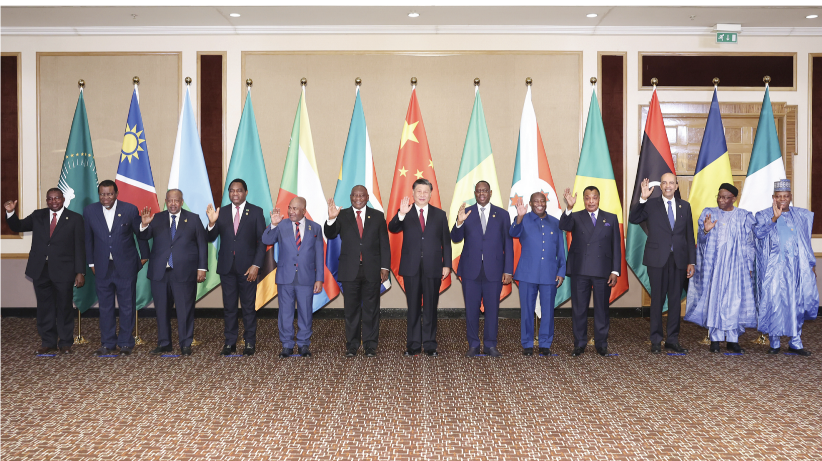
当地时间8月24日晚，国家主席习近平和南非总统拉马福萨在约翰内斯堡共同主持中非领导人对话会。