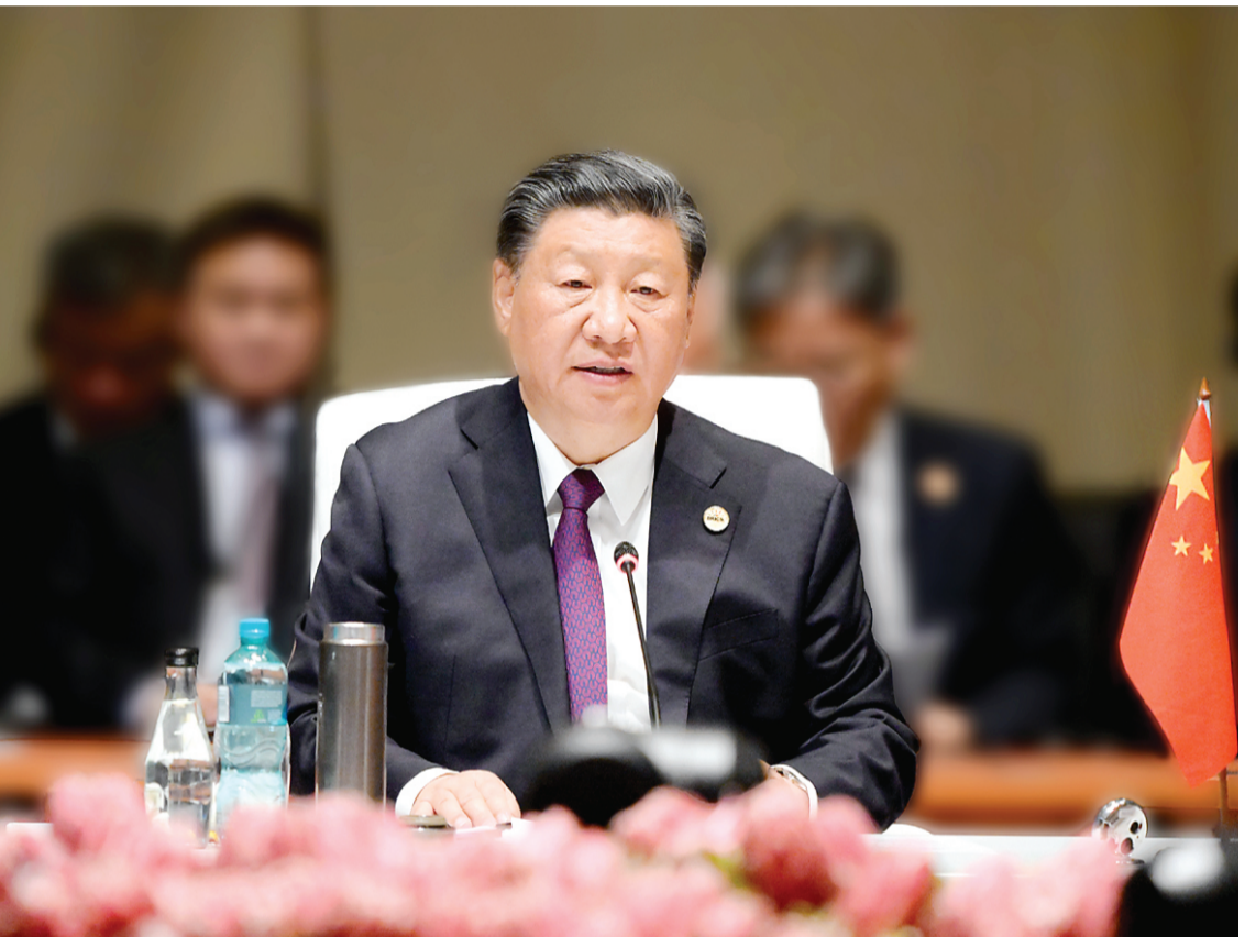
当地时间8月23日上午,金砖国家领导人第十五次会晤在约翰内斯堡杉藤会议中心举行。南非总统拉马福萨主持会晤。中国国家主席习近平、巴西总统卢拉、印度总理莫迪和俄罗斯总统普京(线上)出席。习近平发表题为《团结协作谋发展 勇于担当促和平》的重要讲话。

强调秉持开放包容、合作共赢的金砖精神,以金砖责任应对共同挑战,以金砖担当开创美好未来