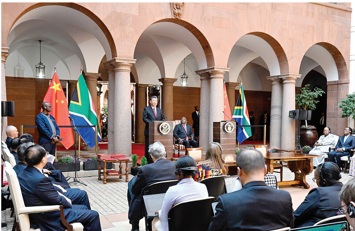
▲当地时间8月22日中午，国家主席习近平在比勒陀利亚总统府同南非总统拉马福萨会谈后共同会见记者。

新华社比勒陀利亚8月22日电(记者 应强 韩墨)当地时间8月22日中午，国家主席习近平在比勒陀利亚总统府同南非总统拉马福萨会谈后共同会见记者。 习近平指出，很高兴应拉马福萨总统邀请，再次对美丽的“彩虹之国”南非进行国事访问。这是我作为中国国家主席对南非进行的第四次国事访问。今年是中南建交25周年。25年来，中南关系实现跨越式发展，战略互信达到新高度，各领域合作全面推进，多边协作更加紧密。中南关系远远超越双边范畴，越来越具有战略意义和全球性影响。 当前，中国共产党正团结带领中国人民以中国式现代化全面推进中华民族伟大复兴，南非也在积极自主探索符合本国国情的发展道路。中南关系面临新的发展机遇。刚才，我同拉马福萨总统举行了富有成果的会谈，就新时代两国关系发展以及共同关心的国际和地区问题交换了意见，达成重要共识。我们见证了一系列重要双边合作文件签署。我对两国友好合作关系前景充满信心。 我和拉马福萨总统都认为，中南两国要做高度互信的战