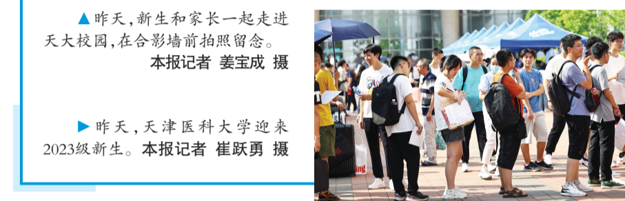
▶昨天,天津医科大学迎来2023级新生。

学第一件“任务”,快速融入学校生活。智能与计算学部工科试验班的迎新帐篷里,除了为新生准备相关文创纪念品,每名新生报到时都能得到来自学部动画专业学