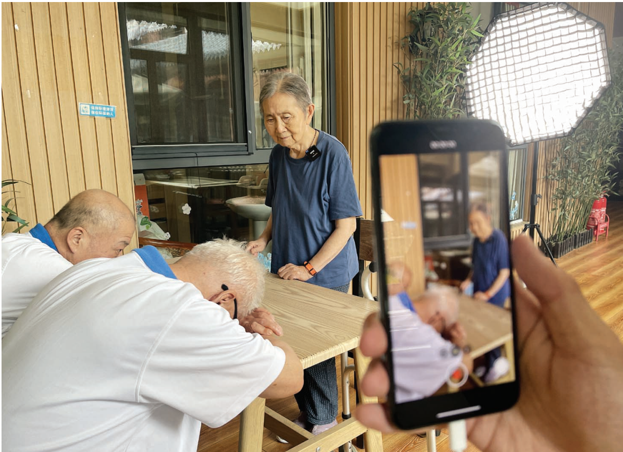
拍摄所用的设备虽然简陋，但过程非常专业。