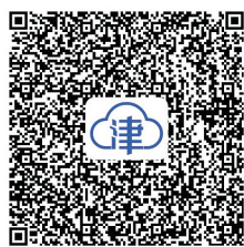
扫一扫 观看相关视频