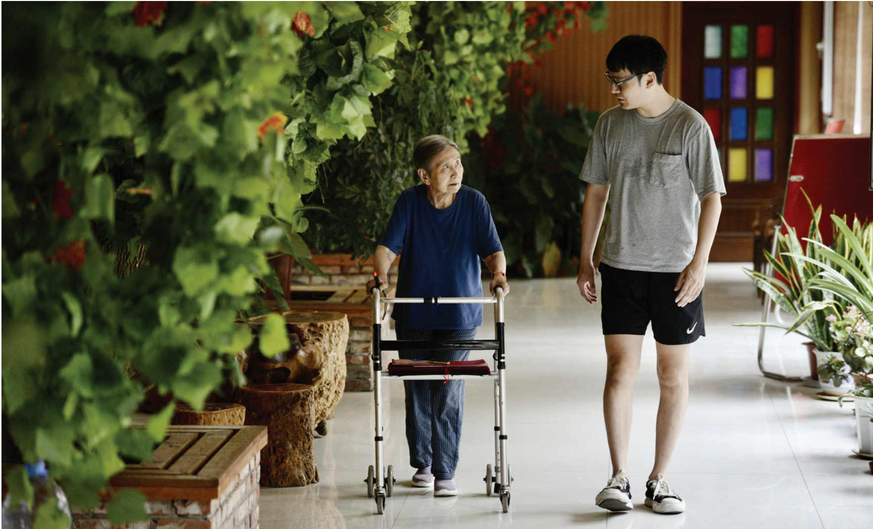
两位“90后”在养老院里聊天散步。