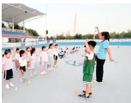
小轮滑爱好者在宁河区双奥运动中心准备训练。

汉沽盐田汪子虾 自然环境优越,天然海水养殖,盐分含量高于海水2-3倍,个个都是“运动健将”。 武清自然熟哈密瓜 当季新鲜采摘,瓜香浓郁,橙色果肉,细滑多汁,回味无穷。