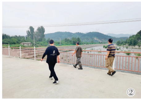
② 杨庄水库管理所工作人员巡查河道。