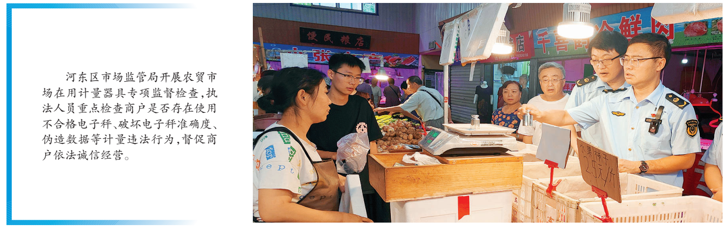
河东区市场监管局开展农贸市场在用计量器具专项检查,执法人员重点检查商户是否存在使用不合格电子秤、破坏电子秤准确度、伪造数据等计量违法行为,督促商户依法诚信经营。

市市场监管委党组书记、主任戴东强要求,市质检院要不折不扣落实援疆工作要求,立足市场监管主责主业,坚持统筹兼顾、突出工作重点、注重民生优先、促进互利交融,多角度支持新疆和田地区产业转型和可持续发展需求,合力解决和田当地最迫切、最实际、最现实问题,营造在中华民族大家庭中手足相亲、守望相助、心心相印的良好氛围,开创具有天津市场监管特色的支援协作工作新格局。