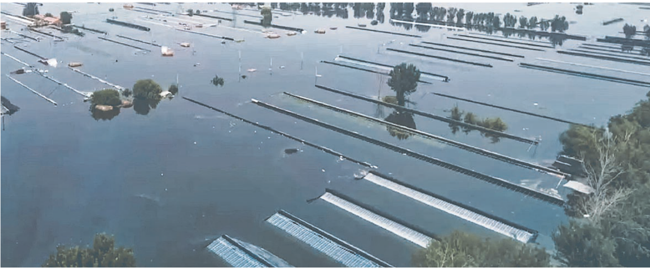
东淀蓄滞洪区西青当城村农田大棚等设施被淹没。