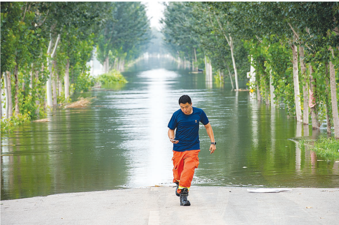
东淀蓄滞洪区静海台头镇内被淹的梁台路。