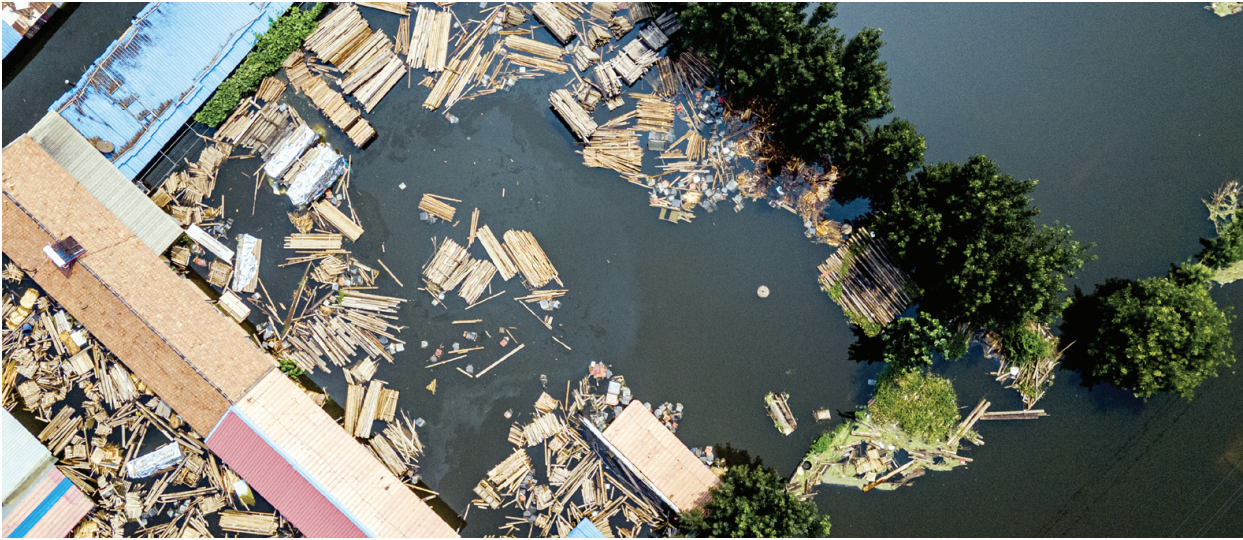
东淀蓄滞洪区内漂起的木材,高度几乎与村民的屋顶齐平。