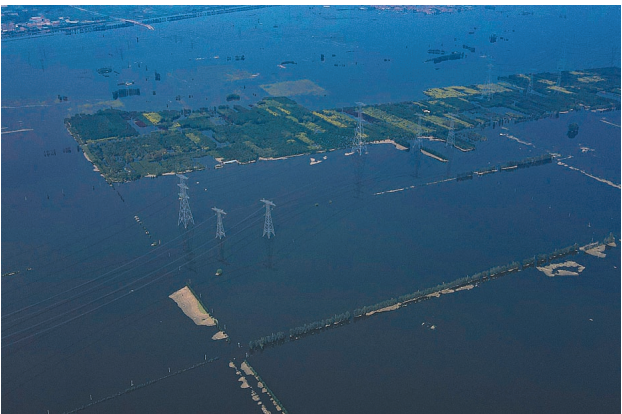
东淀蓄滞洪区静海台头镇围埝外铁塔已浸入水中。