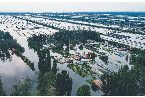
东淀蓄滞洪区西青第六埠村农田大棚等设施。