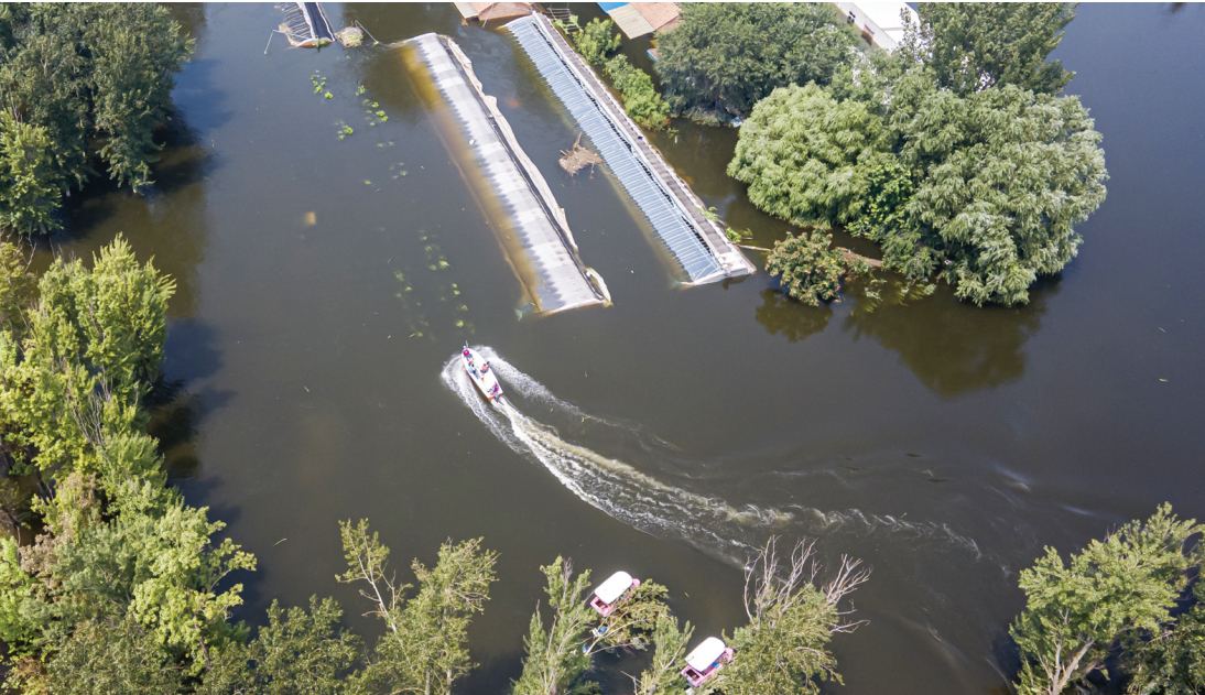
东淀蓄滞洪区西青第六埠村的种植大棚已基本被淹没,部分房屋还可以看到露出水面的屋顶。