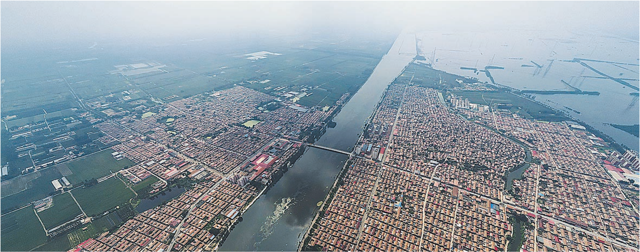
东淀蓄滞洪区静海台头镇全景。