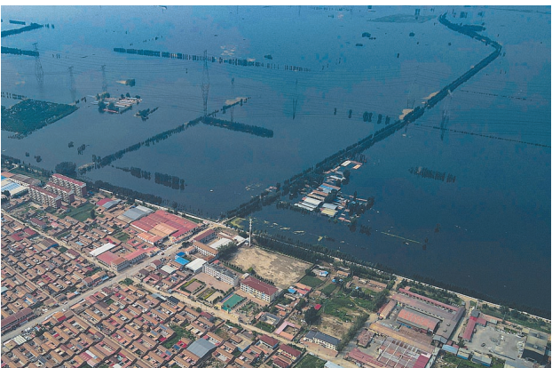
东淀蓄滞洪区静海台头镇围埝外的农田等已被洪水浸泡。