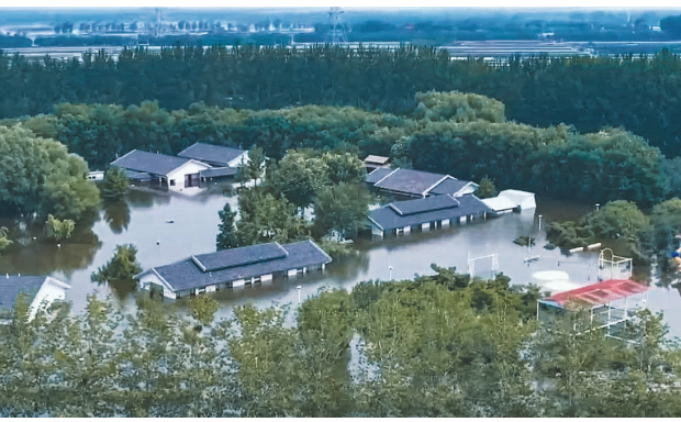
东淀蓄滞洪区西青水高庄村水高庄园。