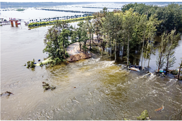
东淀蓄滞洪区内水流流速可见。