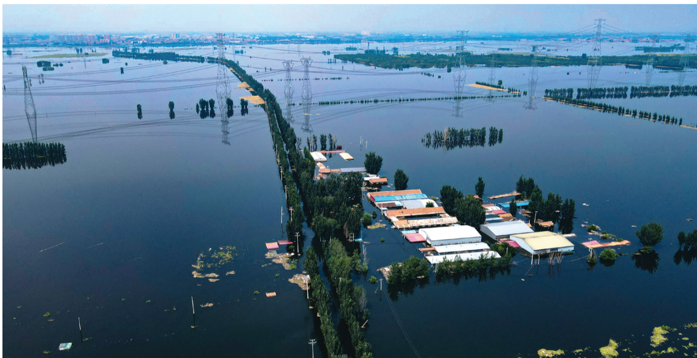
昨日14时,在静海区台头镇俯瞰东淀蓄滞洪区“清北四村”(胜利村、和平村、民生村、建设村)方向,围垡外的农田等设施被洪水浸泡。

远远望去,一片漆黑中,一个个耀眼的光点在不闪灭,就是这些巡堤查险的党员、干部,不分昼夜地坚守在第一线,用责任和担当在河堤岸上筑起了一道坚固的防线。