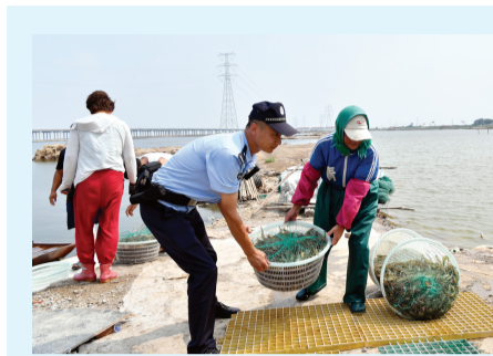
沿海安全保卫总队民警帮助群众抢救鱼获。

为支撑服务全市防汛抗洪,紧急调用40余架警用无人机,56名操作员和地面保障人员,建立“前出外埠、省界值守、近端监测、全时段备勤”机制战法,连夜赶赴受