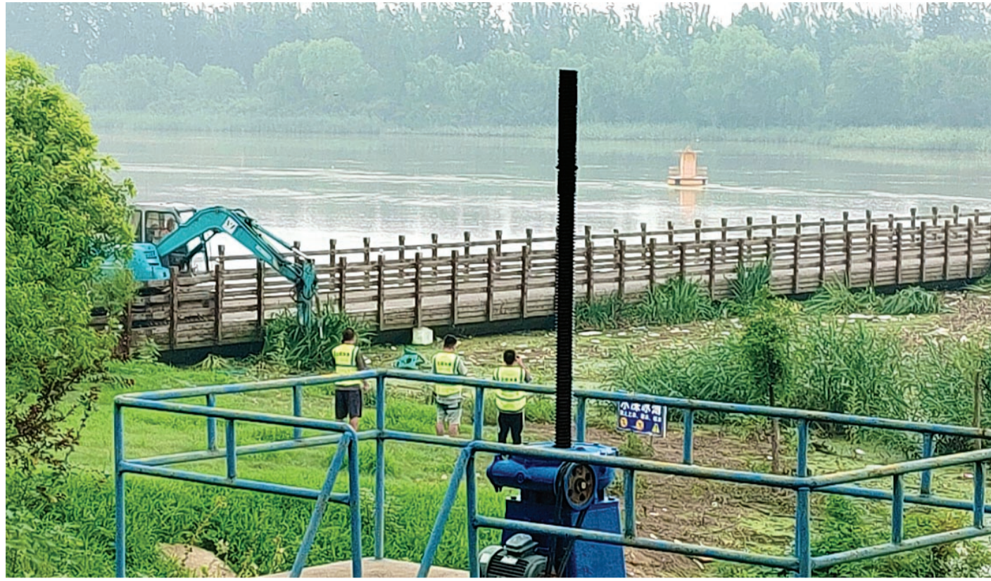
连日来,北辰区不断加强永定新河泛区堤岸巡护,巡河人员24小时不间断对行洪河道开展巡堤查险,及时清理从上冲下来的水草、杂物等阻水物,使河道通畅,确保行洪、堤防安全。

目前,滨海新区加紧对子牙新河沿线巡堤查险,及时消除行洪安全隐患,确保区域防汛安全。永定河行洪过程仍在持续,永定河泛区及下游屈家店枢纽水位上涨,行洪过程总体平稳。市水务部门将统筹调度沿海永定新河防冲闸、蓟运河闸及宁车沽闸,加大下泄流量。