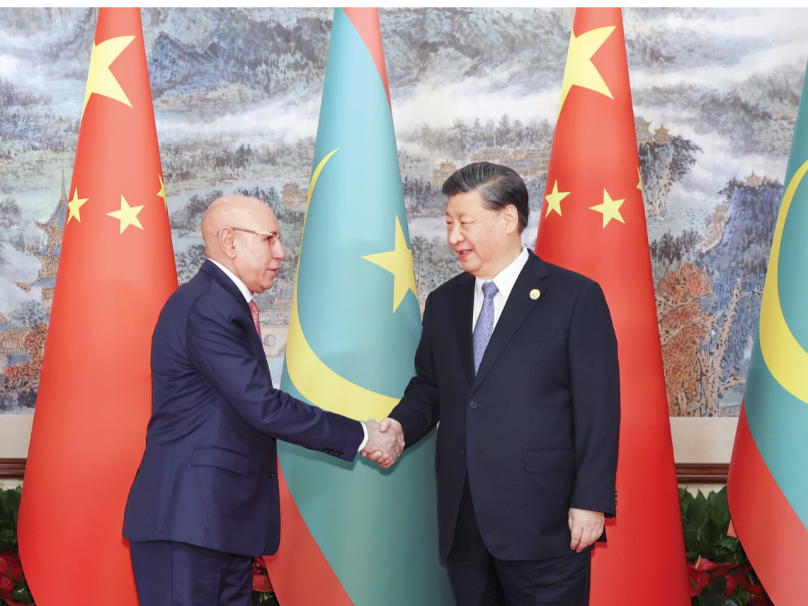
7月28日下午,国家主席习近平在成都会见来华出席第31届世界大学生夏季运动会开幕式的毛里塔尼亚总统加兹瓦尼。