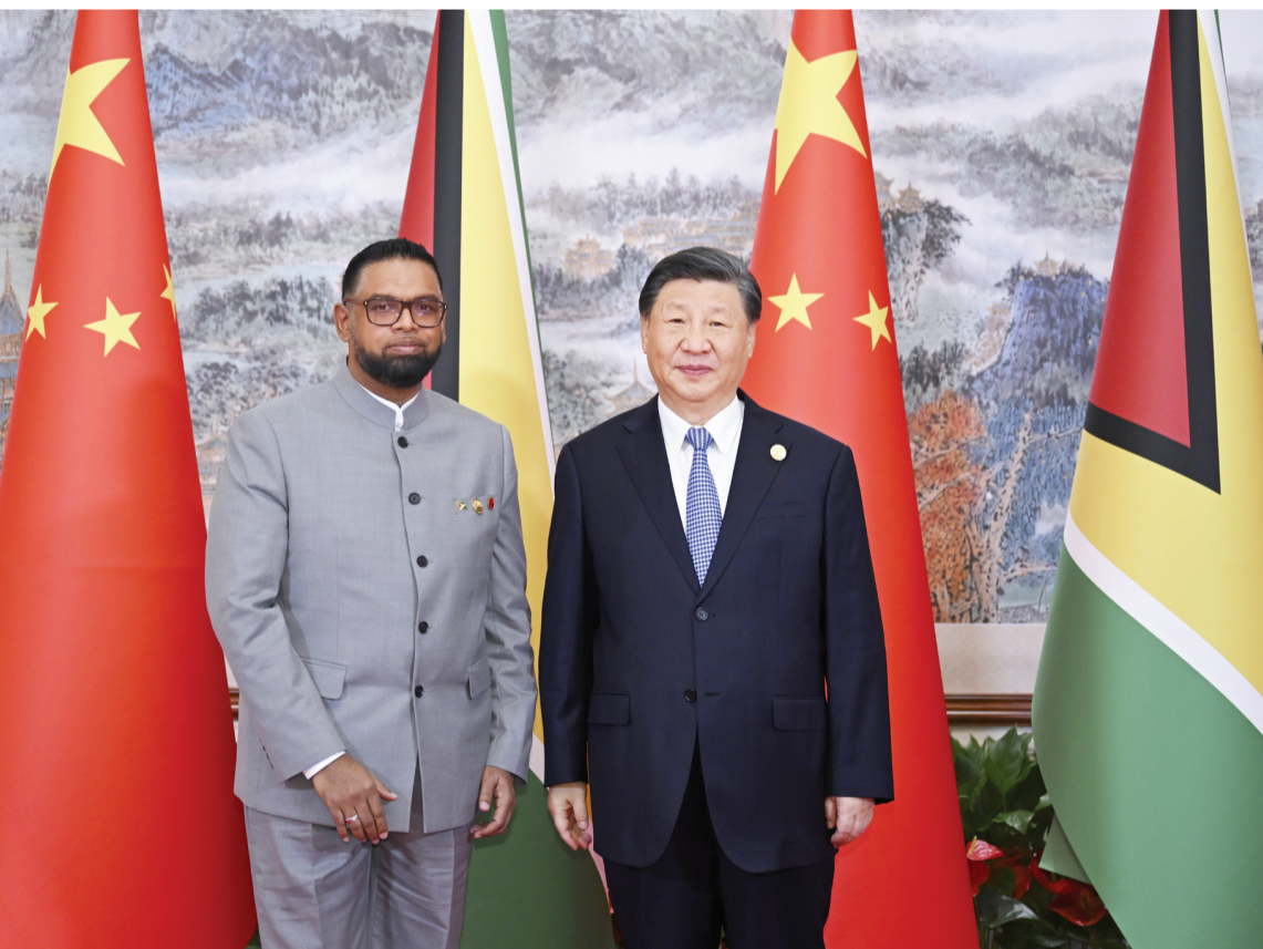
7月28日上午,国家主席习近平在成都会见来华出席第31届世界大学生夏季运动会开幕式的圭亚那总统阿里。