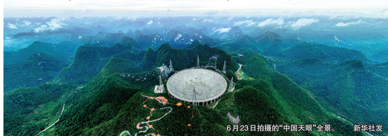
6月23日拍摄的“中国天眼”全景。

新华社贵阳7月25日电 记者25日从FAST运行和发展中心获悉,截至目前,被誉为“中国天眼”的500米口径球面射电望远镜(FAST)已发现800余颗新脉冲星。