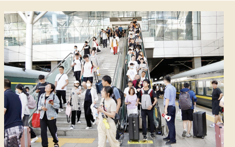
▲随着暑期到来,我市出行旅客增多。