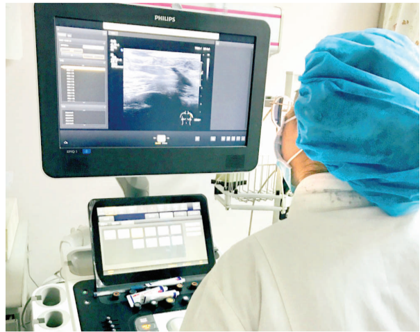
医生在为患者做乳腺超声检查。

2023年我市常见恶性肿瘤联合筛查项目本月已经启动,预计将为8980名40至74岁我市常住居民提供肺癌、乳腺癌、胃癌、肝癌4种常见恶性肿瘤的免费社区初筛,并为初筛检查结果阳性的居民继续提供相应免费的复查。该项目是由市卫生健康委及国家卫生健康委共同资助,市肿瘤医院作为技术支持单位开展的民心工程项目。项目旨在降低我市肺癌、乳腺癌、胃癌、肝癌四种常见恶性肿瘤负担,提高居民健康防癌素养。