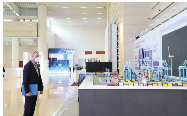
天津港智慧零碳码头展示区。