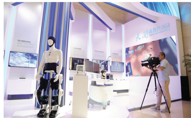
天开高教科创园展示区。