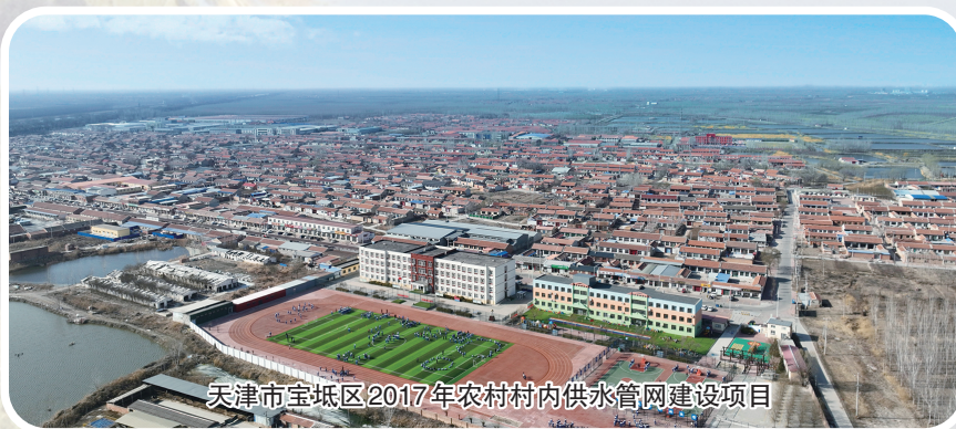
天津市宝坻区2017年农村村内供水管网建设项目