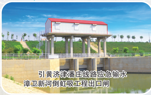
引黄济津潘庄线路应急输水漳卫新河倒虹吸工程出口闸

多年来，水利水电公司在津沽大地承建了引滦水源保护于桥水库综合治理入库沟口湿地工程、天津市宝坻区水系连通及水美乡村建设项目施工等多项重大生态项目，奋进“十四五”，水利水电公司将持续助力生态建设，积极服务经济社会发展大局，奋力将“绿水青山”转化为人民群众可享可及的“金山银山”，绘就人与自然和谐共生的现代化“生态蓝图”，厚重书写清水绿岸、鱼翔浅底的美丽中国作出新的更大的贡献。