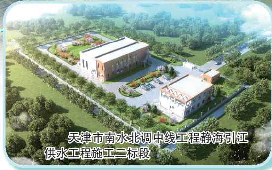
天津市南水北调中线工程静海引江供水工程施工二标段

习近平总书记强调：“南水北调工程事关战略全局、事关长远发展、事关人民福祉。”进入新发展阶段、贯彻新发展理念、构建新发展格局，形成全国统一大市场和畅通的国内大循环，促进南北方协调发展，需要水资源有力支撑。