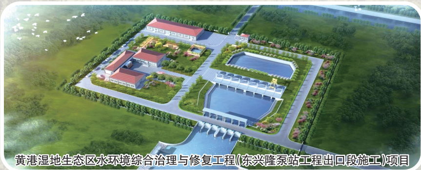
黄港湿地生态区水环境综合治理与修复工程(东兴隆泵站工程出口段施工)项目