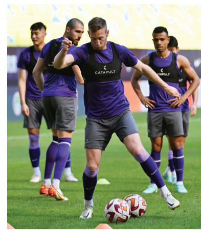
津门虎队主场对阵武汉三镇队的比赛早一天。考虑到球员们比对手少休息一天,再加上路途上的奔波,因此此前天津津门虎队从天津飞抵成都后

上一轮联赛,成都蓉城队和天津津门虎队都经历了一场苦战,不过成都蓉城队客场上海海港队的比赛,比