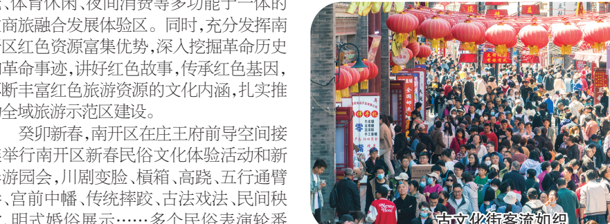
古文化街客流如织

社区养老服务拓展延伸,运营社区老年日间照料中心15家,既为周边老年人提供专业化、便利化的养老服务,又拓展养老机构经营服务范畴,促进了机构的规模化、连锁化发展,打造形成了可复制可推广的城市核心区养老服务模式。 “在家门口就能吃到营养美味的饭菜,我们的晚年生活真是越来越甜啦!”在前不久刚刚挂牌的南开区长虹街道综合养老服务中心,正在食堂享用午餐的社区居民张彩霞老人与同桌的老伙计们异口同声地夸赞。作为一所集康、养、疗、护为一体的综合性医养结合的养老院,这里不仅满足了在院老人的需求,更能辐射周边社区,解决社区老年群体就餐、就医、休闲娱乐、文体活动等多领域全方位的养老需求。 围绕“一小”,多年来,南开区加快建设高质量教育体系,不断提升全学段教育教学质量,全力推进教育资源优质均衡发展。2013年以来,南开区坚持教育优先发展战略,着力补齐学位短板,累计完成9项校舍新建扩建工程,11项校舍改建工程,3处配套学校接收,合计新增中小学学位约1.8万个,按照两年学前教育专项行动计划要求,累计新增学前学位超1.2万个。 在教学质量提升方面,南开区将全区21所初中学校调整建成4个教育发展共同体,全区35所小学调整建成5个教育发展共同体,学区片联盟建设不断加强,学区内各学校的教学管理、教师教研、学科交流、课堂改进等工作水平有效提升。在天津市第七届基础教育教学成果评选中获得特等奖1项,一等奖5项,二等奖2项。五马路小学的《小学劳动教育体系建设的实践研究》荣获基础教育国家级教学成果二等奖,劳动教育案例入选全国劳动教育典型案例。