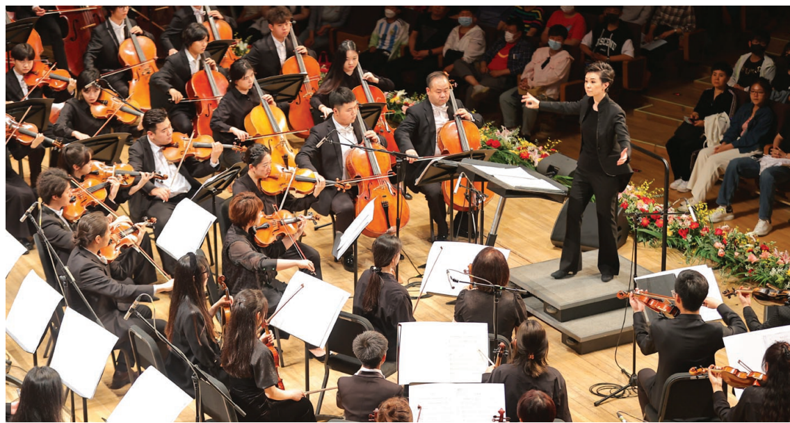
昨日,赵季平作品专场音乐会在天津大剧院上演,天津音乐学院青年交响乐团及青年合唱团参与了演出。

音乐会开场,《丝路音乐瞬间》给观众展现了中国音乐的无穷魅力,通过“钟鼎长安”“汤瓶梦幻”“高原舞狂”三个部分,带领观众走进了丝绸之路的艺术世界。《乔家大院》交响组曲,《“大宅门”写意》等电视剧音乐,讲述了荧屏中一段段令人难忘的经典故事。《将进酒》由著名歌唱家王宏伟领衔演唱,将诗仙李白笔下的传世文字唱出厚重的古意、豪迈的气概,给观众留下深刻印象。