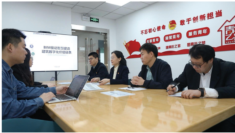
下图 市纪委监委驻市科技局纪检监察组调研天津高教科创园规划建设情况。