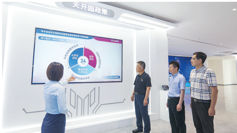
左上图 市纪委监委驻市委教育工委纪检监察组到天津高教科创园开展监督调研。