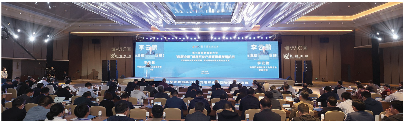
昨日,第七届世界智能大会首场平行论坛——“科创中国”绿色石化产业高质量发展论坛举行。

本报讯(记者 方红 张璐)昨天,第七届世界智能大会首场平行论坛——“科创中国”绿色石化产业高质量发展论坛在滨海新区举行。论坛上,天津经开区发布了支持化工新材料高质量发展方案。该方案将在我市相关方案基础上,结合区域化工新材料产业发展实际,从产业链、中试研发、高端人才引入、绿色低碳转型四方面对化工新材料企业给予重点支持。