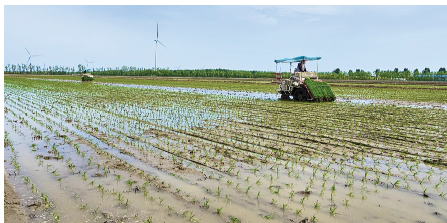
进入立夏时节,我市各涉农区抢抓农时,有序开展水稻插秧作业。 图为宁河区东棘坨镇,农机手操作水稻插秧机在水田中穿梭作业。

“我们要学习借鉴这些好的宣讲经验,在今后的宣讲工作中,讲出理论水平、讲出真情实感、讲出天津特色,把学习宣传贯彻习近平新时代中国特色社会主义思想和党的二十大精神不断引向深入,扎实推动党的创新理论在津沽大地落地生根。”天津市第一中心医院宣传科科长邢玉说。