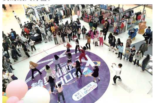
▲今年元旦以来,天津滨海海悦广场举行各类线下活动,吸引了众多消费者前来打卡、购物。

同时,各种新业态新场景对于消费的促进作用也愈发明显,以新场景、新服务为特点的新型消费深受年轻人青睐。其中,各大商圈融合文创市集、优惠活动、夜市场景等诸多元素,积极打造商圈文旅消费新场景,是天津本轮促消费的最大特色。