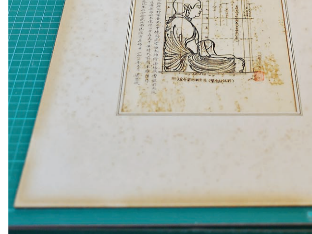
梁思成题字的卡纸,在静静等待着工作人员的妙手回春。