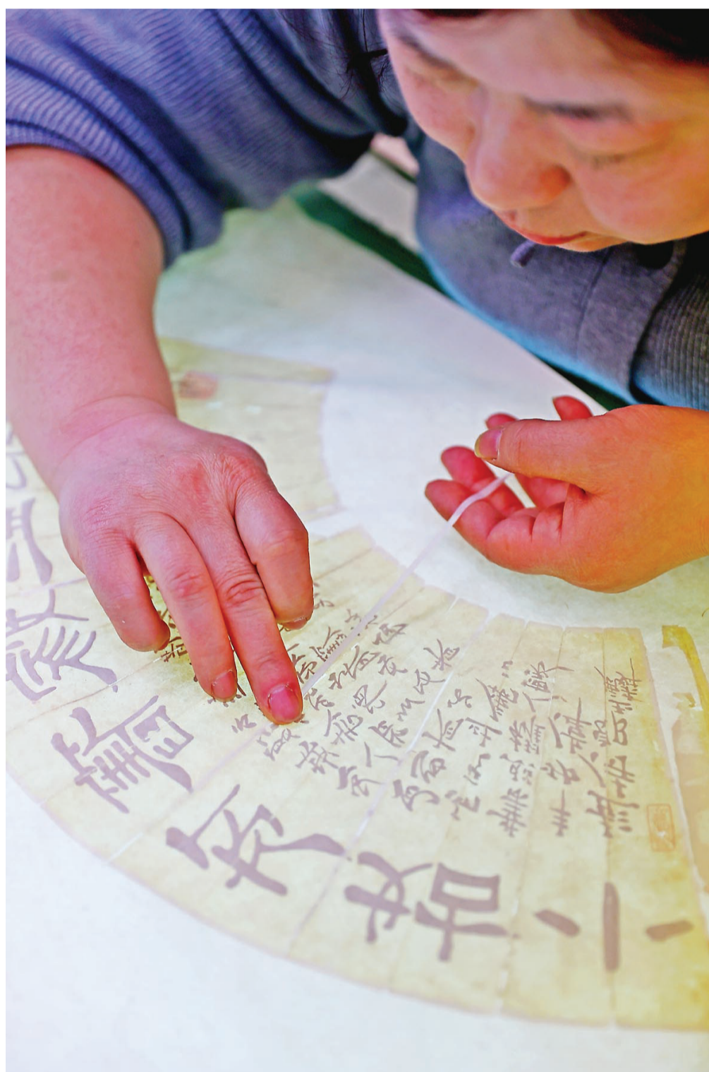
字画的修缮装裱,考验的是修缮操作人员的手上功夫和心里的定力。