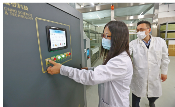
撤展的展品,在进入仓库前,要进行为期半个月消杀,确保它们“无毒无害”。