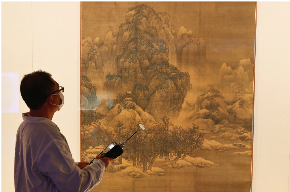
工作人员对于展出的展品,会定时采集环境数据。