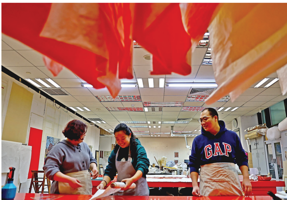
现在越来越多的年轻人喜欢从事文物保护工作。

今年早春的天津博物馆里人潮涌动,镇馆之宝——宋代书画家范宽的《雪景寒林图》,时隔五年再次与世人见面,吸引了众多千里迢迢从各地来津专门看展的游客。40余天的展期结束后,如这幅跨越千年的珍品一样的诸多藏品,怎样存放?如何“保养”?才能让它们的一丝一绢,一笔一墨跨越时空界限,依然气势磅礴地再现世人眼前?