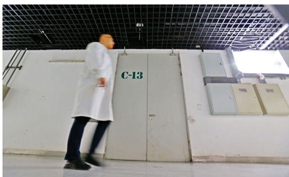
恒温恒湿、防虫防腐的文物库房,存放着岁月的痕迹。