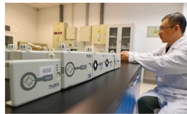
各种各样的环境数据采集器,为展出的文物提供了一个安全的环境。