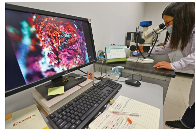
金相检测,对于金属文物的保存修缮至关重要。