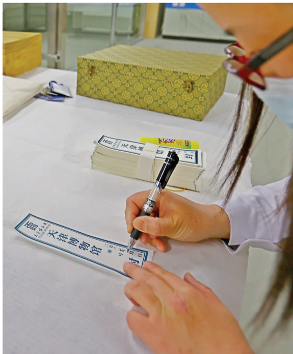
小小一条封条,代表着对文物的爱护与责任。