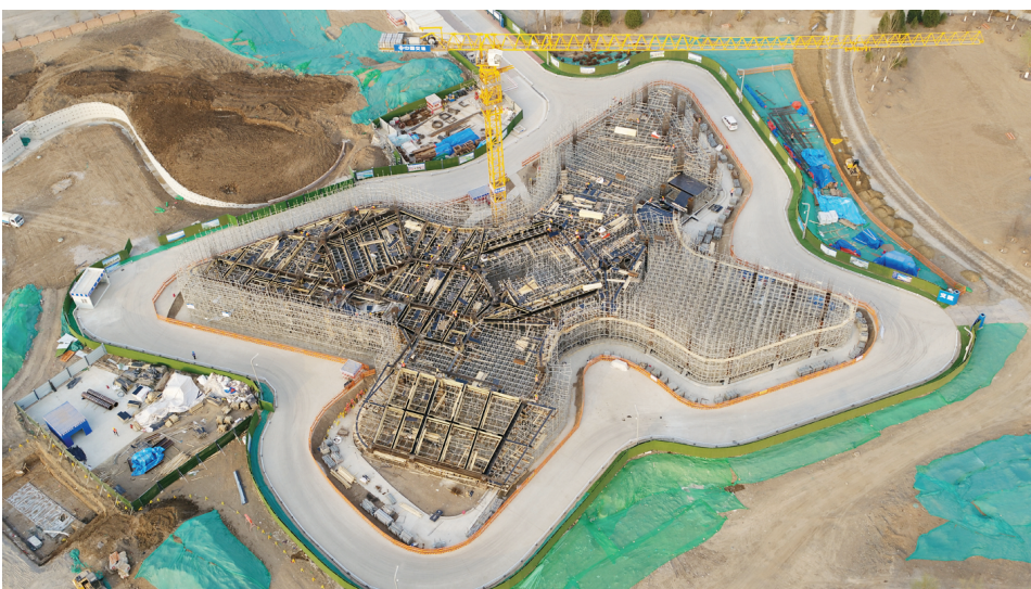
柳林桥一期内的生态科技馆主体施工。

本报讯(记者 胡萌伟)4月7日,中交投资有限公司2023年劳动竞赛启动仪式在天津海河柳林“设计之都”核心区综合开发PPP项目(以下简称“天津‘设计之都’项目”)柳林桥一期施工现场举行,标志着天津“设计之都”项目建设全面提速。记者了解到,作为天津“设计之都”项目的另一重要子项——去年16万余人参与设计方案投票的柳林桥,也将于本月正式开工。