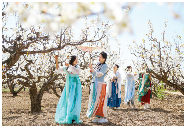
昨日,静海区良王庄乡梨花节在多兴庄园拉开帷幕,不少游客身穿汉服盛装打扮,穿梭于梨花之间,享受闲暇惬意好时光。

“体验了一次从天津坐环球影城巴士往返,可以单程也可以往返,发车、返回时间都按照开园闭园时间安排,还挺方便。”天津女孩李晓溪是环球影城的年卡用户,这次清明节假期解锁了新的出行方式。据介绍,北京环球影城推行年