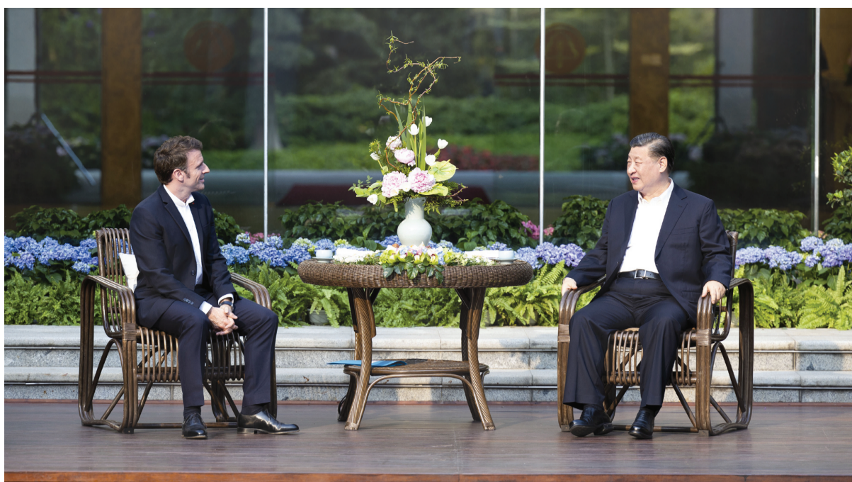
4月7日下午，国家主席习近平在广东省广州市松园同法国总统马克龙举行非正式会晤。两国元首并肩而坐，观景品茗，纵论古今。

天津海河传媒中心出版 国内统一连续出版物号CN 12-0001 1949年1月17日创刊 第27011号