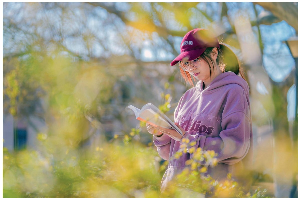
重回往日,也拾回校园应有的气质。