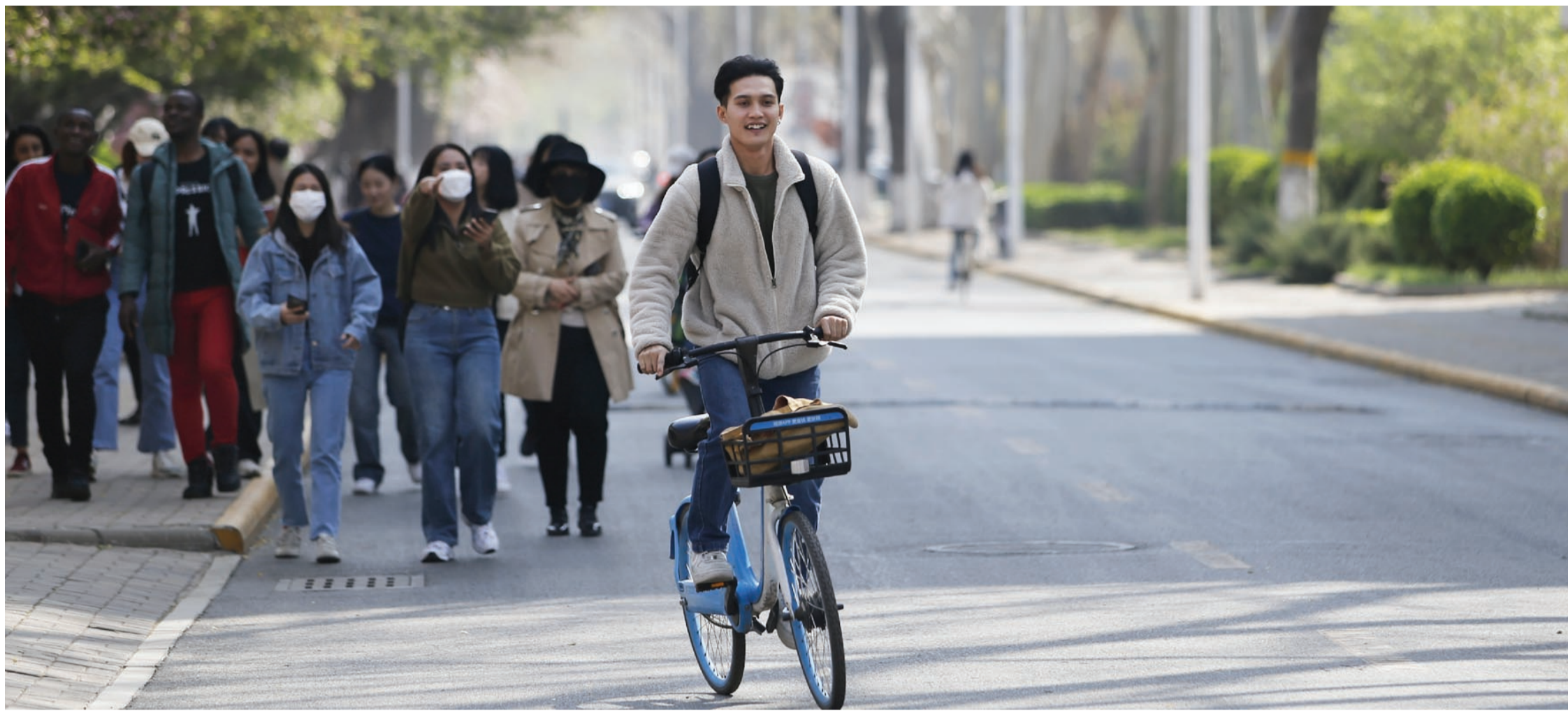
校园里又恢复了三年前的样子。