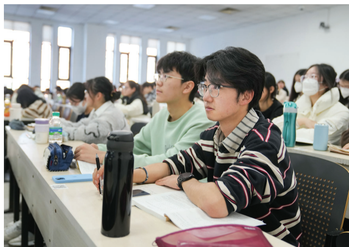
教学楼里秩序已然。