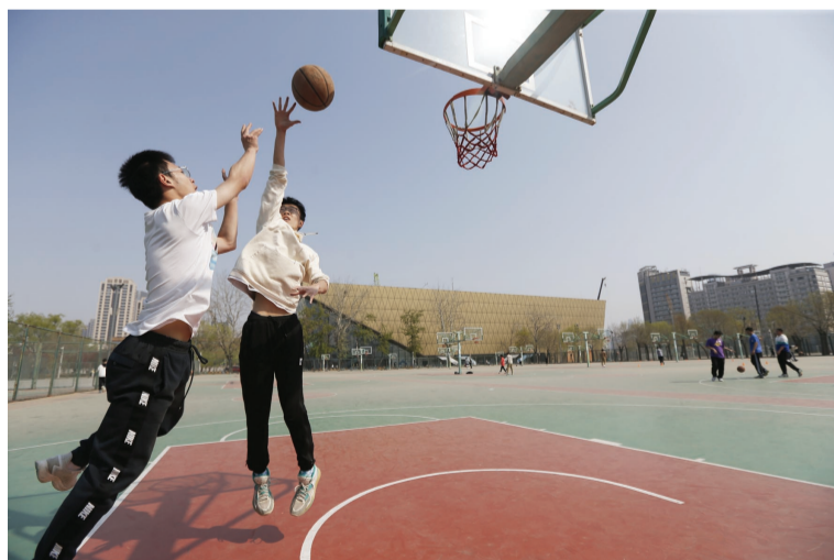
运动场上活力再现。