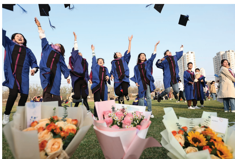
毕业生美美地享受典礼时刻。