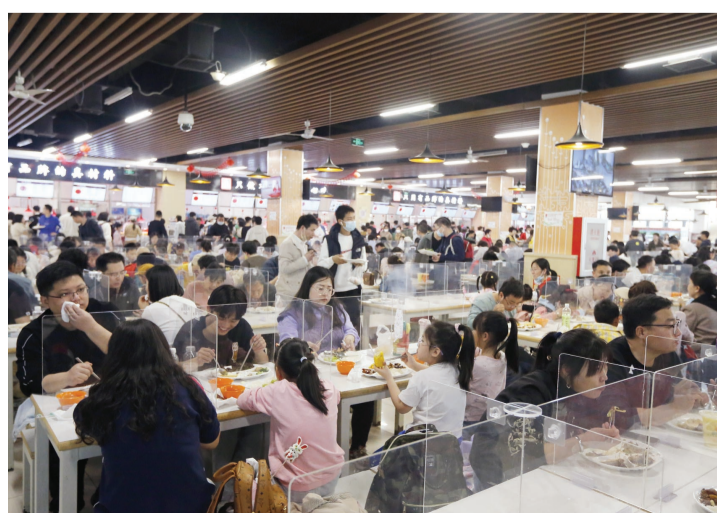
熙熙攘攘的食堂,又现往日模样。