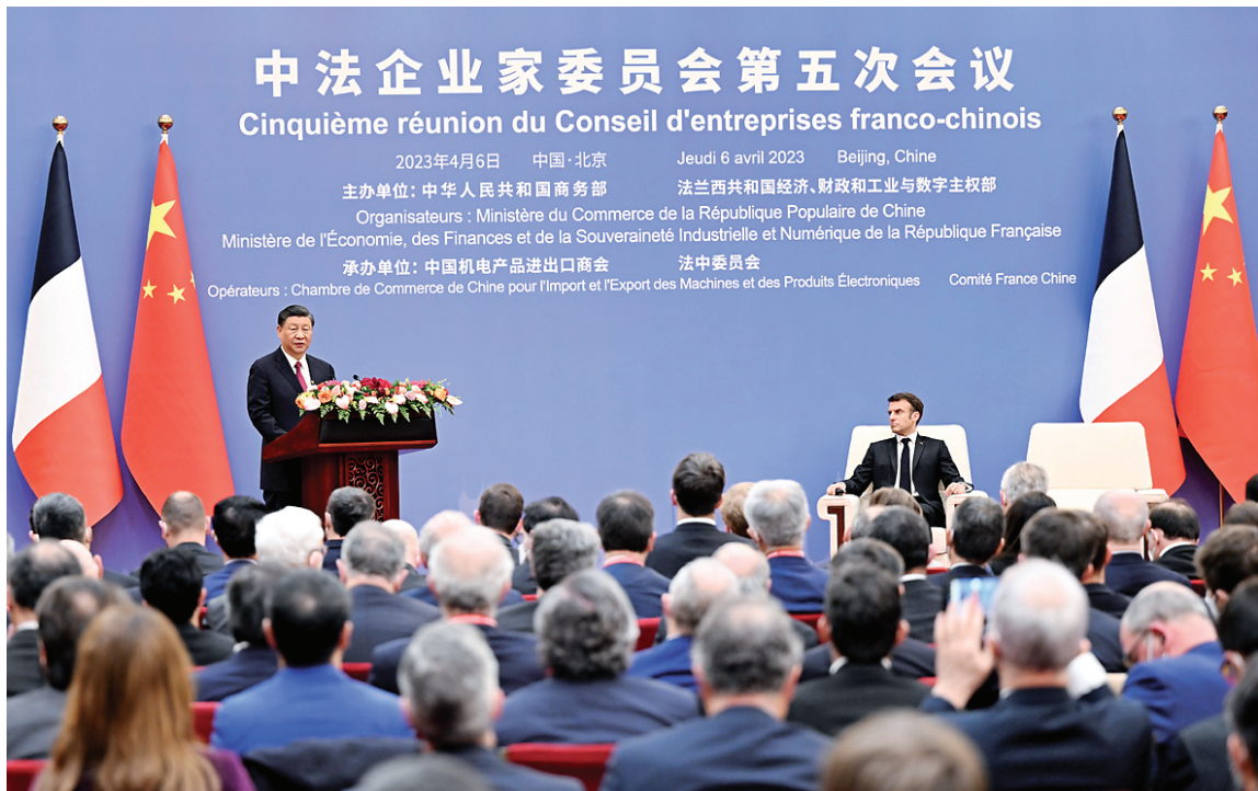
4月6日下午,国家主席习近平在北京同法国总统马克龙共同出席中法企业家委员会第五次会议闭幕式并致辞。

新华社北京4月6日电(记者 刘华)4月6日下午,国家主席习近平在北京同法国总统马克龙共同出席中法企业家委员会第五次会议闭幕式并致辞。 习近平指出,世界正发生深刻复杂变化。面对困难和挑战,中法两国坚持真正的多边主义,坚持自由贸易和经济全球化正确方向,极大增强了双边经贸合作的韧性和活力。双边贸易额和相互直接投资稳步增长,大项目合作深入推进,绿色消费、绿色能源、科技创新等新兴领域合作不断拓展。 中法经贸合作不仅助推两国经济发展、增进民生福祉,而且为世界经济复苏增强了信心、稳定了预期。当前,中国经济社会活力充分释放,中法、中欧各领域对话合作全面激活,我们应该抓住机遇,加强合作,共创美好未来。 我们要坚持开放包容,深化双边互利合作。中国将加快开拓国内市场,同时大力推进高水平对外开放,稳步扩大规则、规制、管理、标准等制度型开放,愿同包括法国在内的世界各国分享中国式现代化带来的新机遇。中方支持法国