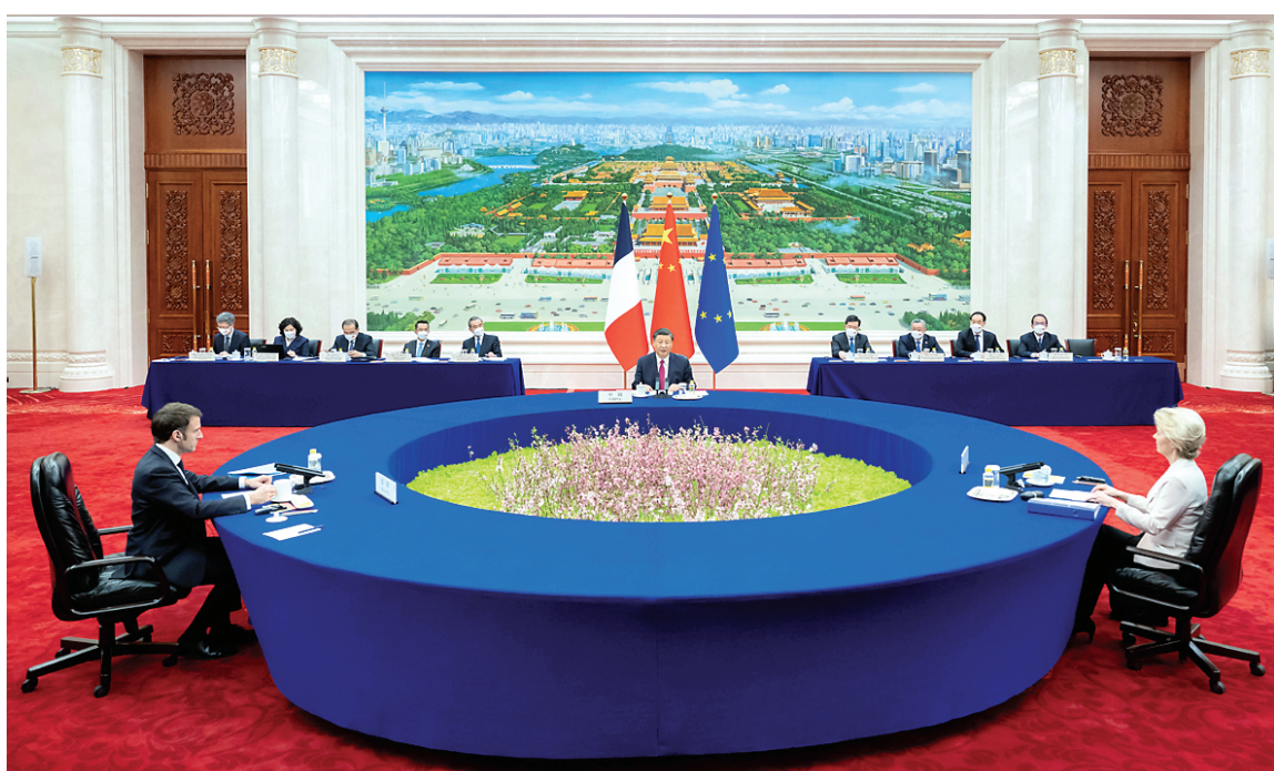
4月6日下午,国家主席习近平在北京人民大会堂同法国总统马克龙、欧盟委员会主席冯德莱恩举行中法欧三方会晤。

新华社北京4月6日电(记者 刘华)4月6日下午,国家主席习近平在人民大会堂同法国总统马克龙、欧盟委员会主席冯德莱恩举行中法欧三方会晤。