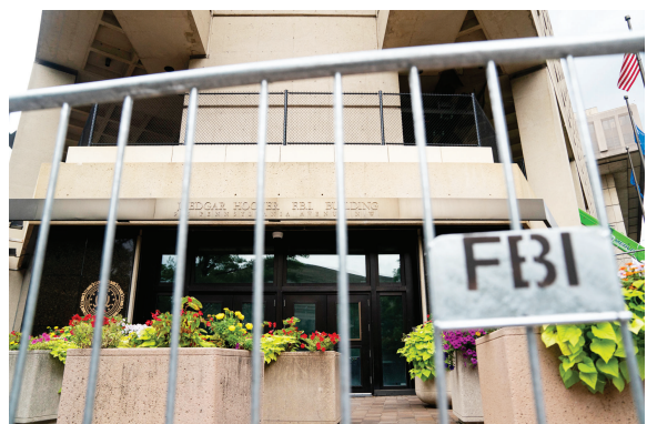
2022年8月16日,美执法部门称,特朗普海湖庄园遭搜查后,美执法部门面临更多威胁。

目前,特朗普还面临联邦和州层面其他数项刑事调查,涉及他在“国会山骚乱”中的角色、卸任美国总统时对机密文件的处理等。特朗普否认自己有不当行为。 尽管共和党内部对特朗普有明显不同看法,但围绕特朗普因“封口费”案被刑事起诉总体态度一致——指责民主党人布拉格滥用职权,将司法“武器化”对特朗普进行“政治攻击”。美国国会众议院议长、共和党人凯文·麦卡锡称,国会将对指控特朗普的检察官布拉格进行问责。 白宫新闻秘书卡里娜·让-皮埃尔4日在例行记者会上没有就特朗普被起诉和应诉直接置评,称这不是美国总统拜登关注的重点。 美国律师、前联邦检察官安库什·卡杜里在《纽约时报》撰文写道:“特朗普被刑事起诉开创‘危险先例’——布拉格是第一个对美国前总统提出刑事指控的地方检察官,但可能不会是最后一个——未来民主党总统卸任后,也可能成为共和党地方检察官进行刑事起诉和调查的对象。” 法国《回声报》网站的评论文章指出,美国政治生态加剧分裂,使行政、立法和司法三个系统之间的责任分工日益模糊,人们对司法系统出现前所未有的信心丧失。