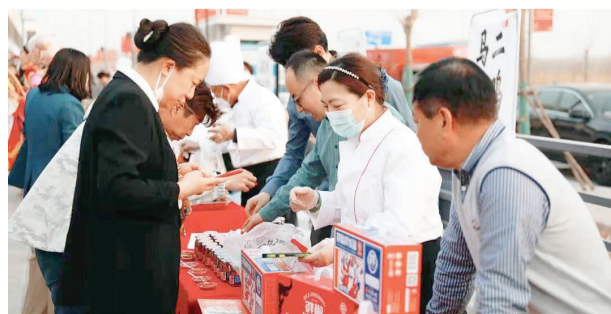
宁河特色美食走进中国民航大学(宁河校区)。

识”。近年来,作为传统农业大区的宁河,打出畅通销售渠道“组合拳”,充分挖掘区内绿色食材资源优势,组织“宁河米仓、美食天堂”系列活动,持续开展“美食进校园”“美食进大众”“美食进滨城”等特色活动,集中展示宁河美食风貌、农特优产品、非遗老字号文化、乡村振兴成果、东西部协作对口支援农特产品等。