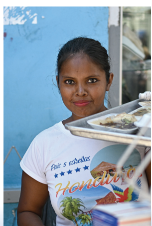
一名女子在洪都拉斯首都特古西加尔巴的一处街道上售卖小吃。