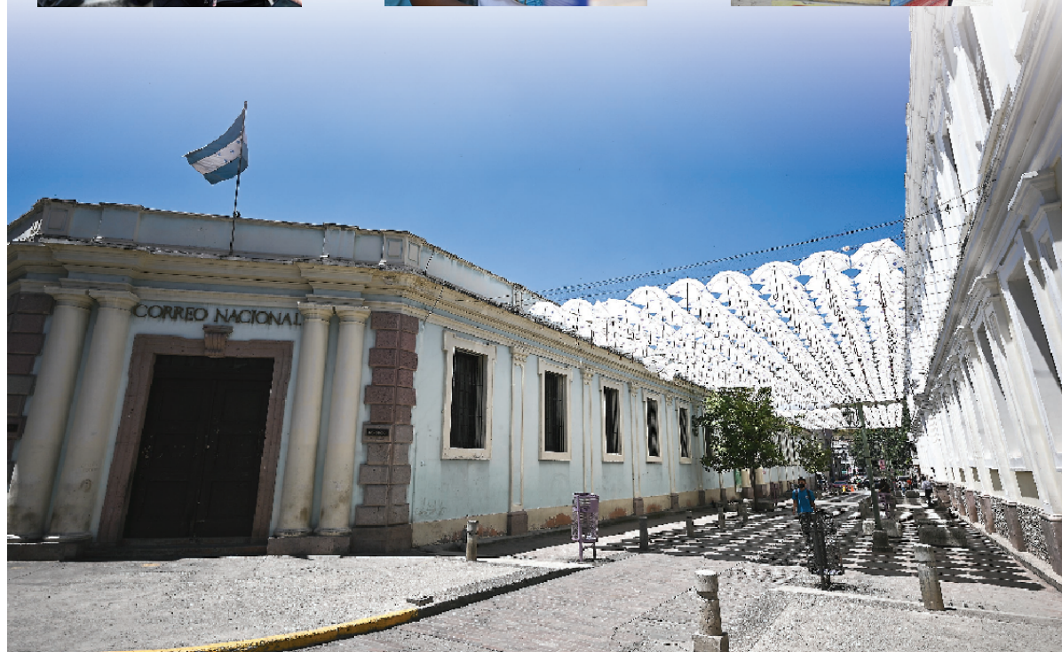
在洪都拉斯首都特古西加尔巴拍摄的洪都拉斯国家邮局。