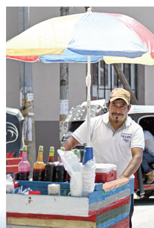
一名男子在洪都拉斯首都特古西加尔巴的一处街道上售卖小吃。