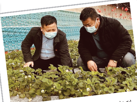
宁河区桥北街道纪检监察干部到大薄前村家庭农场特色设施农业采摘示范园项目进行实地考察。