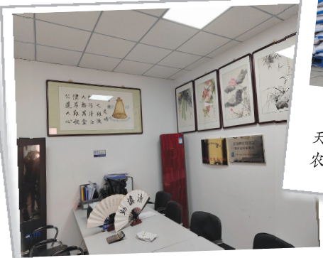
滨海新区杨家泊镇依托李自沽村图书室打造廉洁文化角。