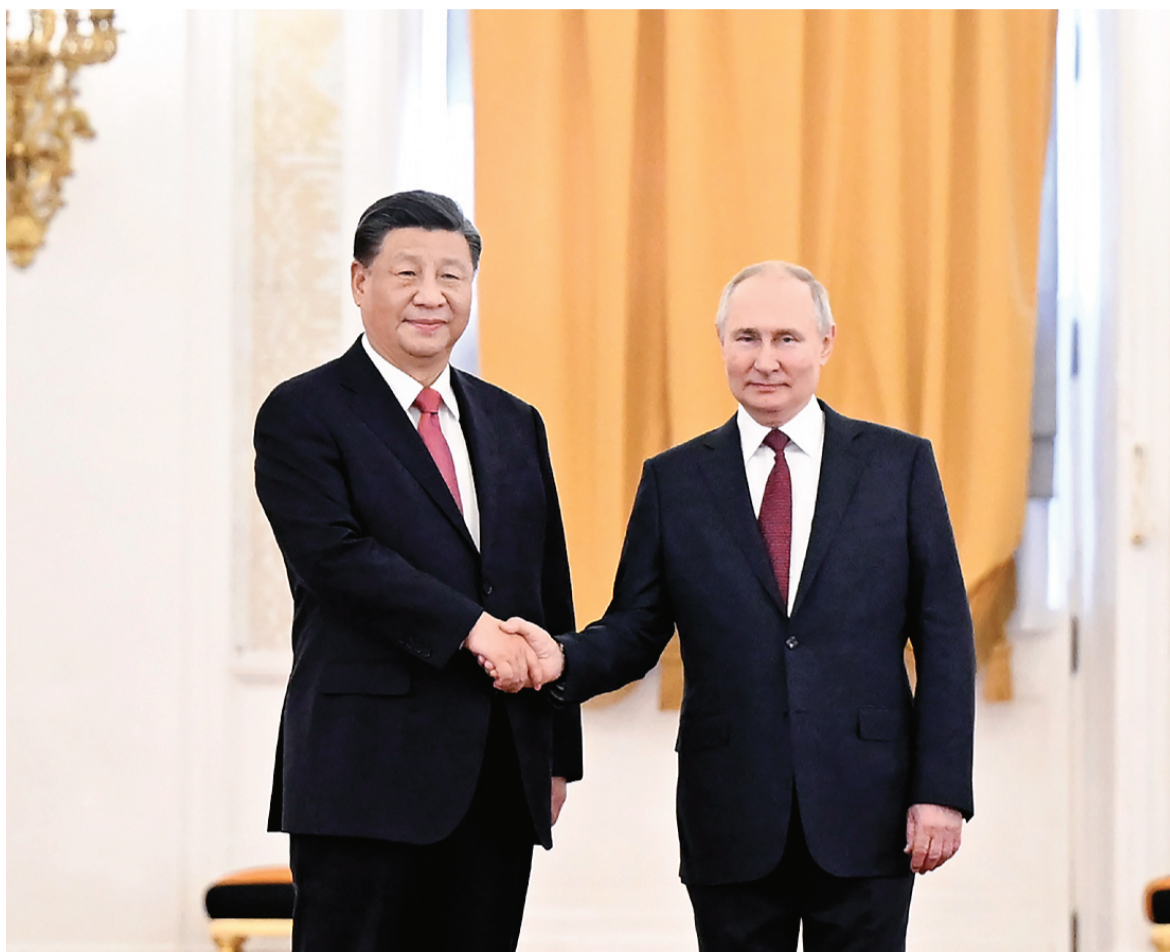
当地时间3月21日下午,国家主席习近平在莫斯科克里姆林宫同俄罗斯总统普京举行会谈。普京在乔治大厅为习近平举行隆重欢迎仪式。这是两国元首紧紧握手,合影留念。