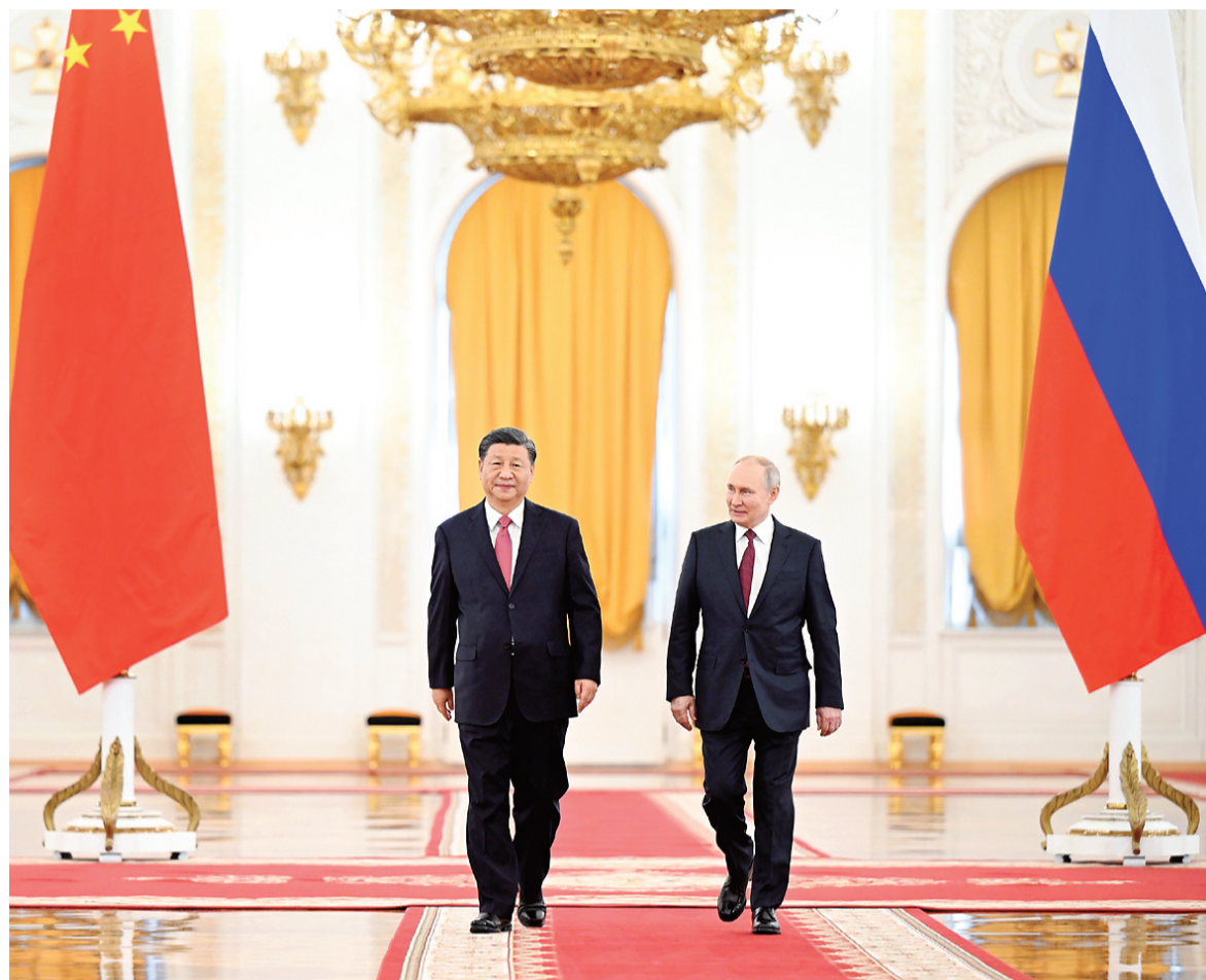
当地时间3月21日下午,国家主席习近平在莫斯科克里姆林宫同俄罗斯总统普京举行会谈。这是普京在乔治大厅为习近平举行隆重欢迎仪式。