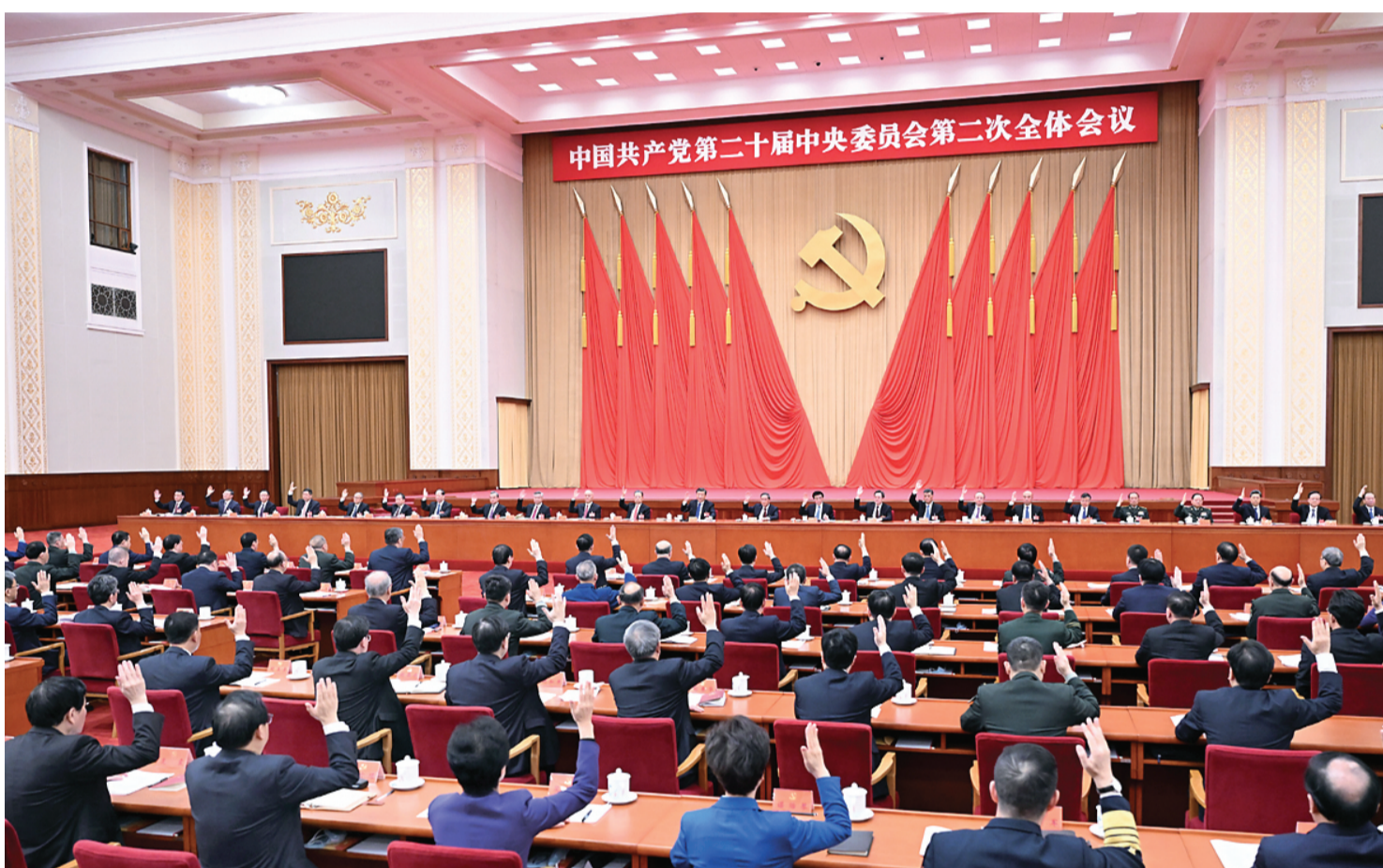
中国共产党第二十届中央委员会第二次全体会议,于2023年2月26日至28日在北京举行。中央委员会总书记习近平作重要讲话。