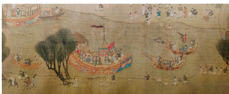
仇英(款)《清明上河图》卷(局部)

宣德炉”的状态,懂艺术的不懂艺术的,家里都得买点艺术品,“苏州片”的销售,不乏“以假充真”,但也有人知假买假、专门买仿制品,这些仿制品的艺术价值也是颇高的,价格不菲。当然,“苏州片”的水平也有高下之分,比如这次展出的仇英(款)《玉阳洞天图》卷和仇英(款)《清明上河图》卷,二者虽然都是“苏州片”中的佳品,但个人认为,《玉阳洞天图》卷的艺术水平要更高,更接近仇英的笔法,属于“高仿”。