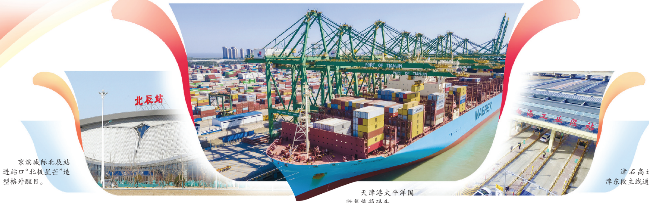
京滨城际北辰站进站口“北极星芒”造型格外醒目。