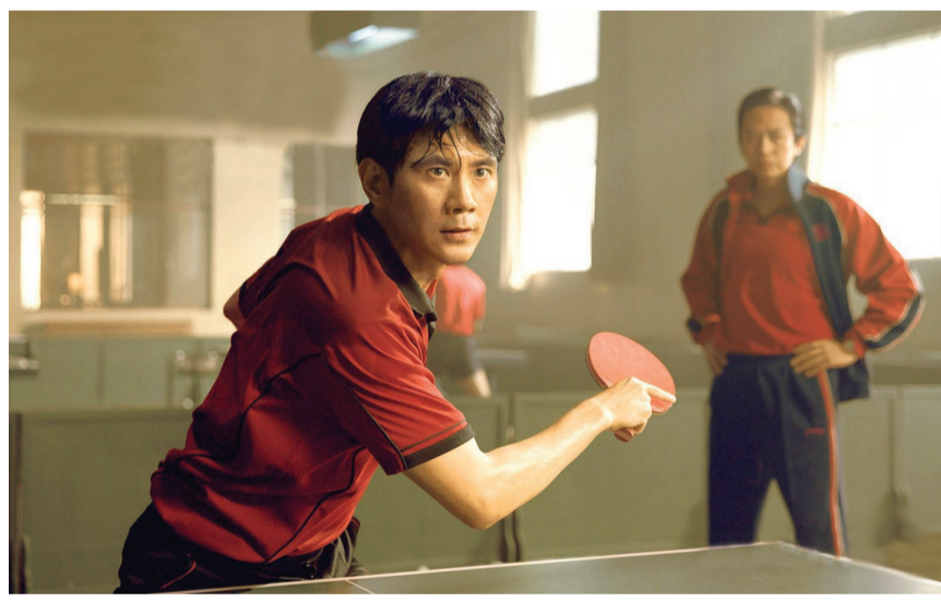
电影《中国乒乓之绝地反击》剧照

经历低谷的我市电影市场自今年元旦前后逐步复苏,春节档的全面爆发、电影消费券发放等多重利好消息助推票房以最快速度突破2亿元大关,为我市电影市场的强劲复苏吹响了集结号。截至目前,我市已在美团、大众点评、猫眼等平台发放10轮电影消费券。特别是2月1日电影消费券优化发放方式以来,由原来周一发、七天有效改为每天发放、两天有效,观众可以随时抢券购票观影,更