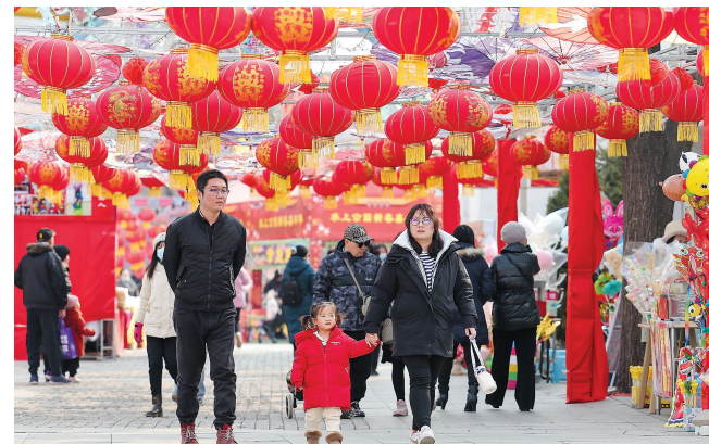
昨日是正月十六,天津有“遛百病”的习俗,不少市民走出家门,外出游玩,祈福新的一年健康平安。图为市民在水上公园内游玩。

和骨干专业技术人才1万余人;深入实施“海河英才”卡制度,给予人才住房安居、子女入学、配偶就业等方面的“一揽子”服务保障。 五是全力完善工资收入分配制度,深化企事业单位工资制度改革,健全工资决定机制和支付保障机制,促进居民人均可支配收入保持与经济增长基本同步。 六是全力构建和谐稳定的劳动关系,提升劳动关系治理效能,强化监察执法和争议调解仲裁,持续抓好根治欠薪,促进劳动关系和谐稳定。 七是全力打造人民满意的人社服务,持续加强系统法治、行风和信息化建设,为企业和群众提供更加方便快捷的公共服务。