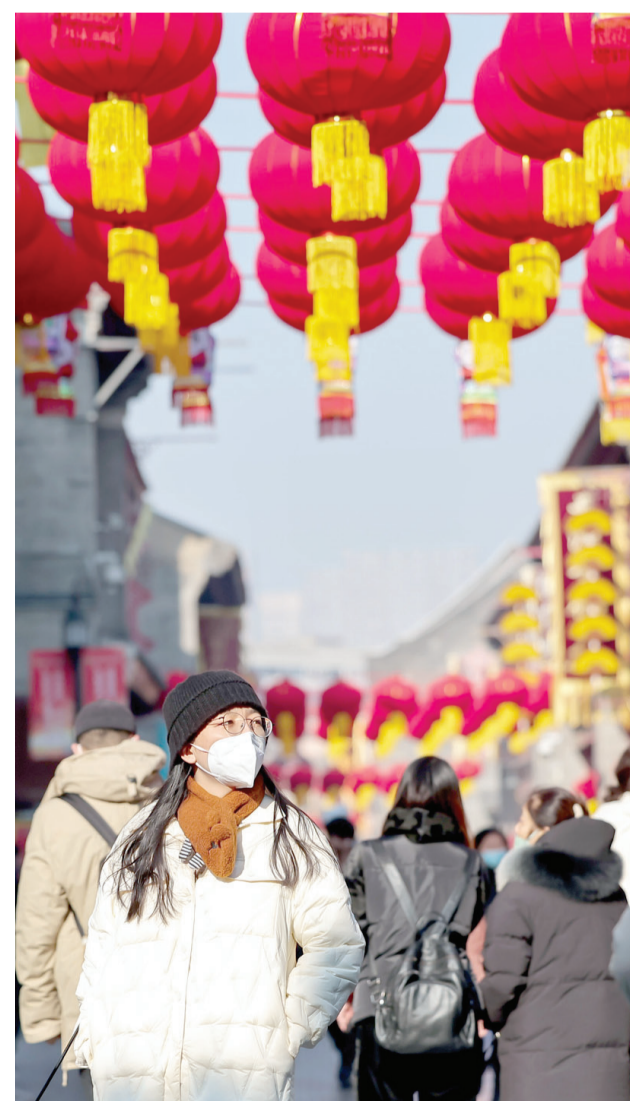
元旦假期首日，我市古文化街迎来众多游客游古街、品小吃、买年货，在浓浓的喜庆氛围中迎接新年的到来。