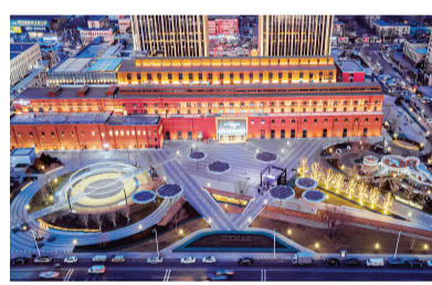
昨天,天津金茂汇盛装纳客。

的同时与市民日常生活需求相结合,更是河东区向天津市培育建设国际消费中心城市工作交出的一份高质量答卷。