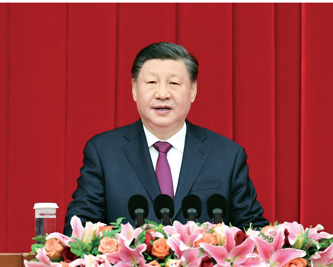
12月30日，全国政协在北京举行新年茶话会。中共中央总书记、国家主席、中央军委主席习近平在茶话会上发表重要讲话。