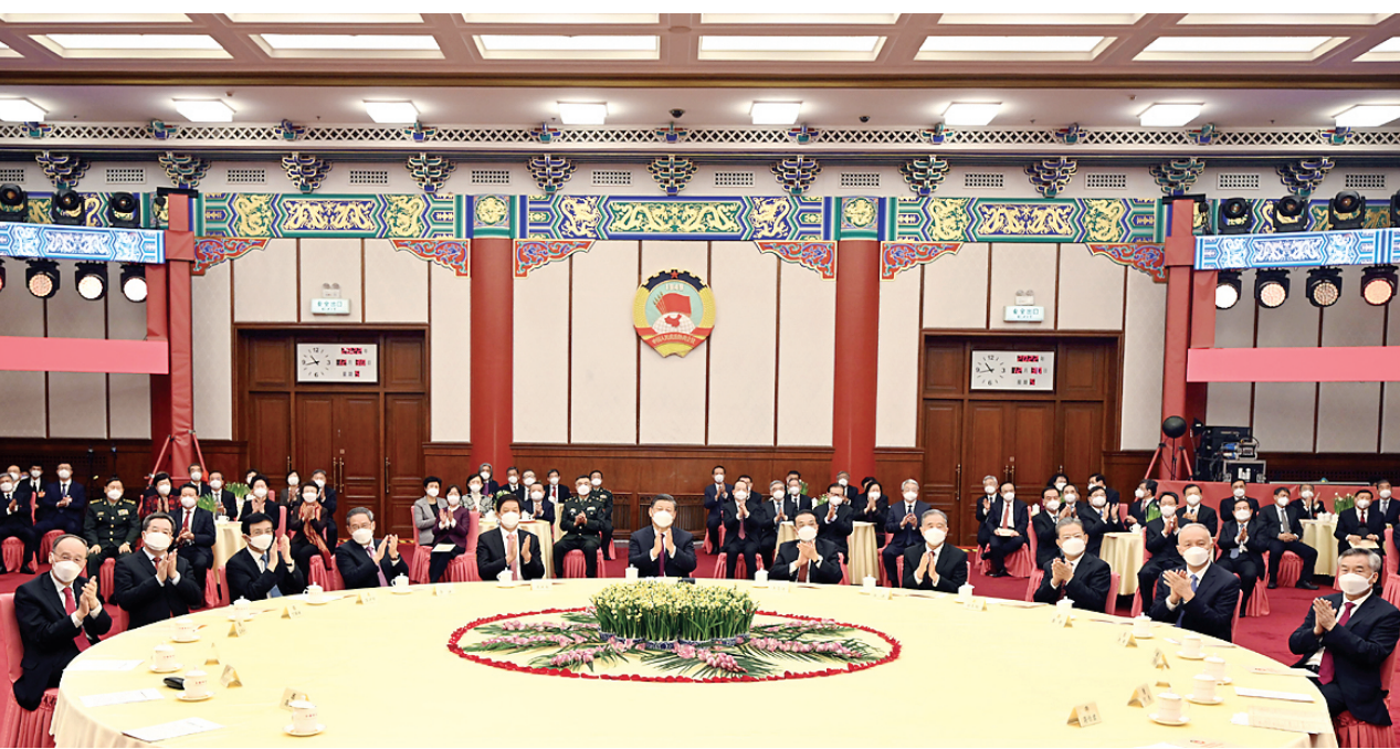
12月30日，全国政协在北京举行新年茶话会。党和国家领导人习近平、李克强、栗战书、汪洋、李强、赵乐际、王沪宁、蔡奇、丁薛祥、李希、王岐山出席茶话会并观看演出。

新华社北京12月30日电 中国人民政治协商会议全国委员会12月30日上午在全国政协礼堂举行新年茶话会。党和国家领导人习近平、李克强、栗战书、汪洋、李强、赵乐际、王沪宁、蔡奇、丁薛祥、李希、王岐山等同各民主党派中央、全国工商联负责人和无党派人士代表、中央和国家机关有关方面负责人以及首都各族各界人士代表欢聚一堂，共迎2023年元旦。 中共中央总书记、国家主席、中央军委主席习近平在茶话会上发表重要讲话。他强调，2023年是全面贯彻落实党的二十大精神开局之年。开局关乎全局，起步决定后程。我们要以斗争精神迎接挑战，以奋进拼搏开辟未来，努力实现全年目标任务，为实现第二个百年奋斗目标奠定良好基础。 习近平代表中共中央、国务院和中央军委，向各民主党派、工商联和无党派人士，向全国各族人民，向香港同胞、澳门同胞、台湾同胞和海外侨胞，向关心和支持中国现代化建设的各国朋友，致以节日的问候和诚挚的祝福。