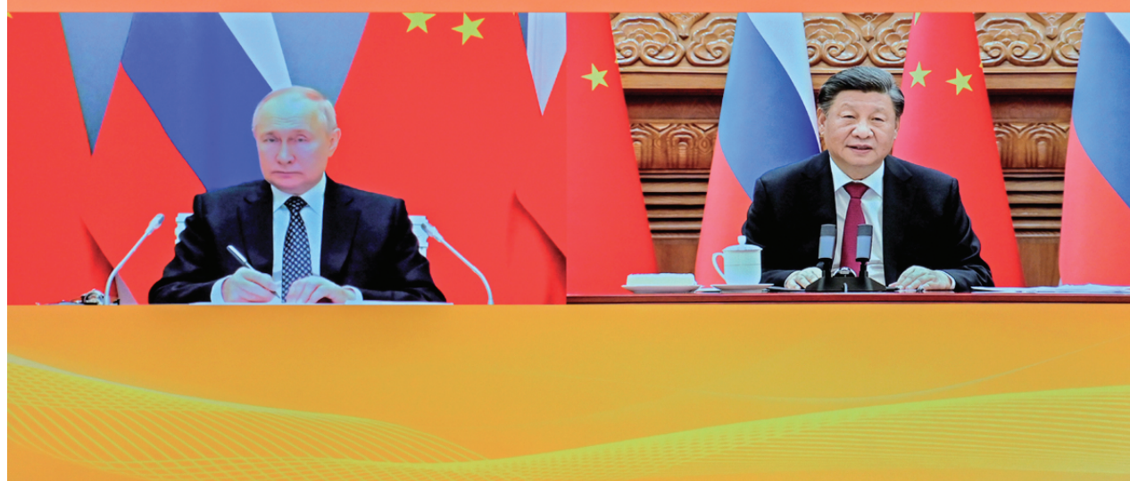
12月30日下午，国家主席习近平在北京同俄罗斯总统普京举行视频会晤。