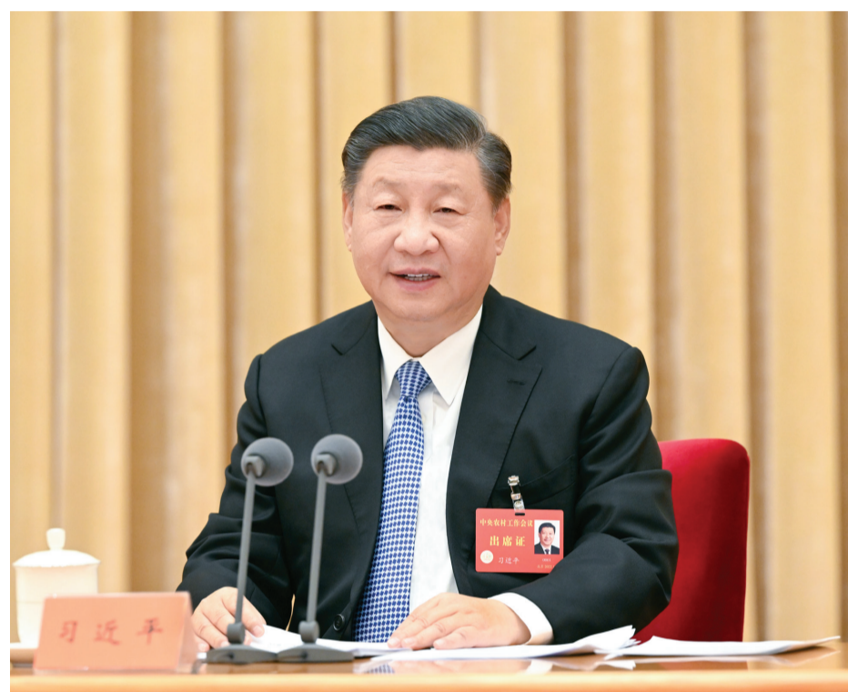
12月23日至24日，中央农村工作会议在北京举行。中共中央总书记、国家主席、中央军委主席习近平出席会议并发表重要讲话。

习近平强调，要依靠科技和改革双轮驱动加快建设农业强国。要紧盯世界农业科技前沿，大力提升我国农业科技水平，加快实现高水平农业科技自立自强。要着力提升创新体系整体效能，解决好各自为战、低水平重复、转化率不高等突出问题。要以农业关键核心技术攻关为引领，以产业急需为导向，聚