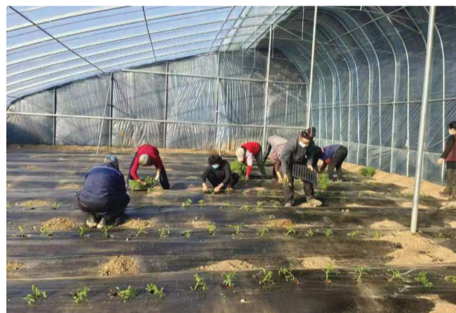
官家屯村设施农业种植基地挥洒汗水种植忙。