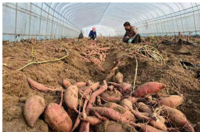
红薯种植基地大丰收。