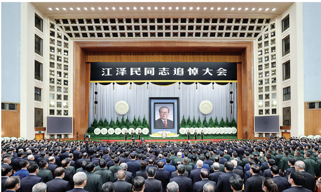
12月6日，中共中央、全国人大常委会、国务院、全国政协、中央军委在北京人民大会堂隆重举行江泽民同志追悼大会。