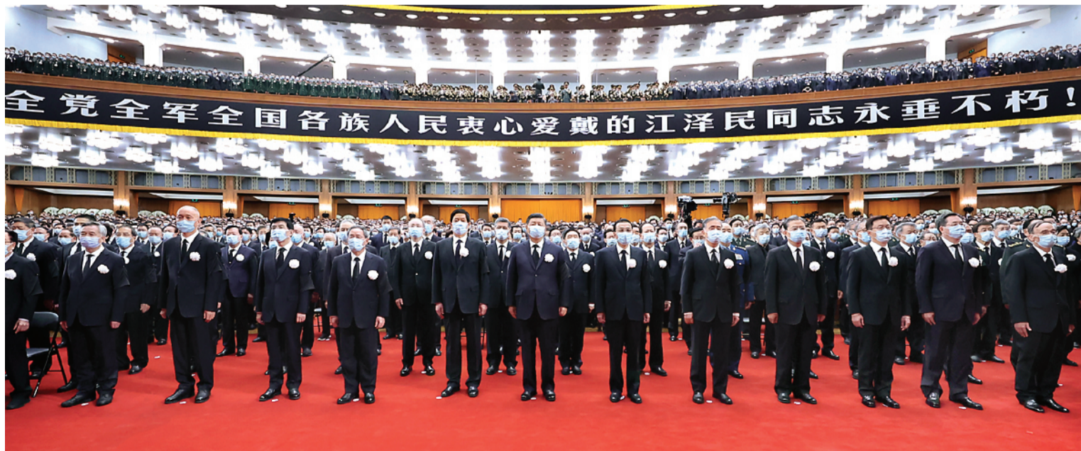
12月6日，中共中央、全国人大常委会、国务院、全国政协、中央军委在北京人民大会堂隆重举行江泽民同志追悼大会。习近平、李克强、栗战书、汪洋、李强、赵乐际、王沪宁、韩正、蔡奇、丁薛祥、李希、王岐山等参加大会。新华社记者 鞠鹏 摄