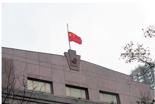
11月30日,中国常驻联合国代表团驻地下半旗志哀,悼念江泽民同志逝世。