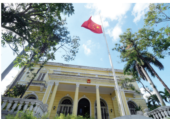
11月30日,中国驻古巴大使馆下半旗志哀,悼念江泽民同志逝世。