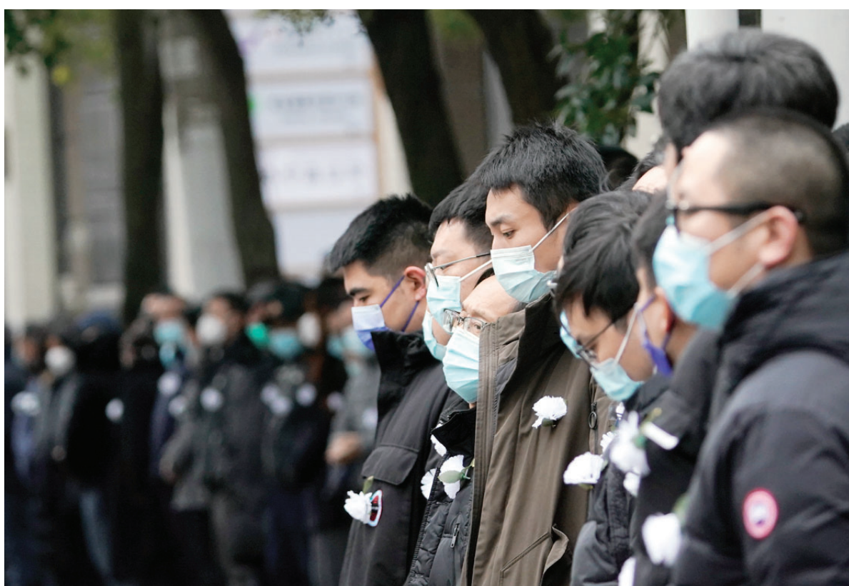
12月1日,江泽民同志的遗体从上海由专机敬移到达北京。这是上海各界群众在沿途送行。