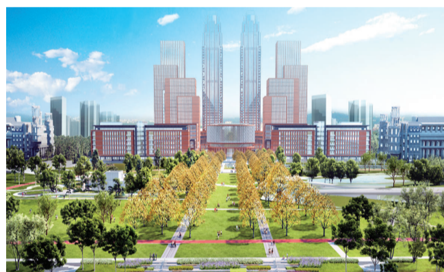
产业配套设施效果图。

3层左右,在严格控制城市整体风格前提下,可以充分发挥设计师的创作想象,调动个性化、多样性的建筑创作设计,丰富和繁荣我市小型公共建筑设计创作,成为特色鲜明的建筑网红打卡地。