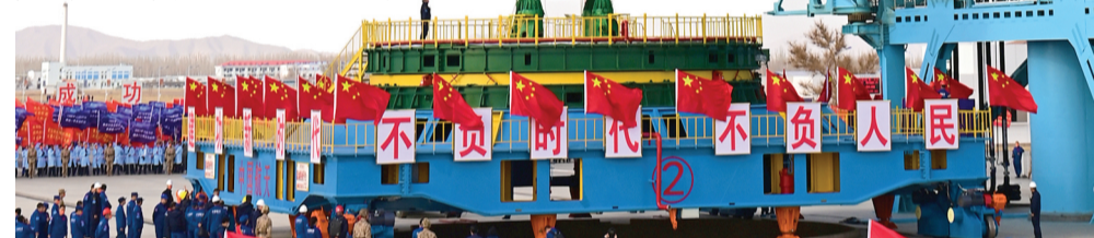
11月21日,神舟十五号载人飞船与长征二号F遥十五运载火箭组合体转运至发射区。

季启明表示,中国载人航天探索的脚步不会只停留在近地轨道,一定会飞得更稳、更远。按照我国政府批准的发展战略,我们已经完成了载人月球探测关键技术攻关和方案深化论证。通过前一阶段的工作,突破了新一代载人飞船、新一代载人运载火箭、月面着陆器、登月服等关键技术,形成了具有中国特色的载人登月任务实施方案。这些工作为载人月球探测工程奠定了坚实的基础,我们已经具备开展工程实施的条件。