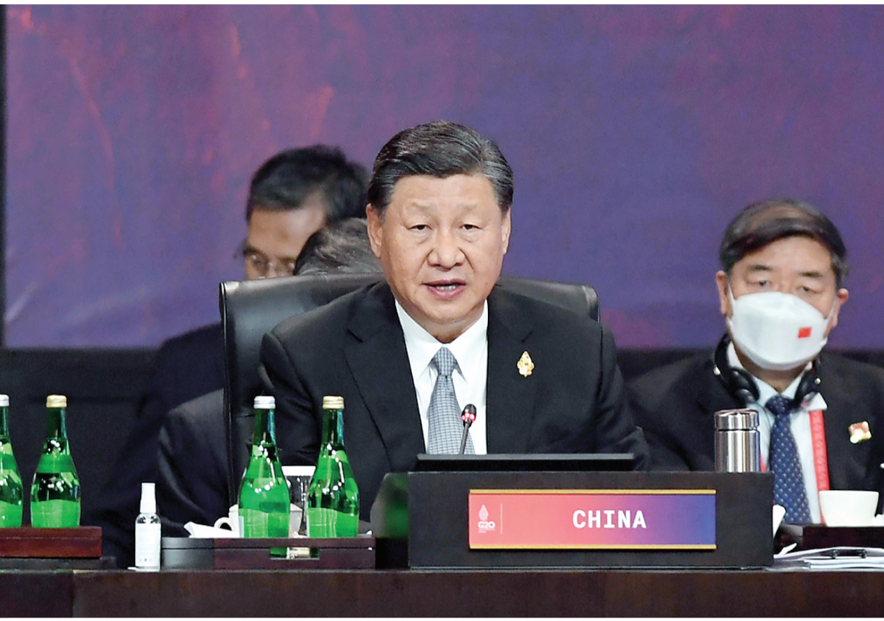
当地时间11月16日,二十国集团领导人第十七次峰会在印度尼西亚巴厘岛继续举行。国家主席习近平出席并发言。