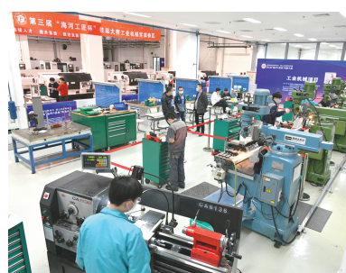
第三届“海河工匠杯”技能大赛现场。本报记者 胡凌云 通讯员 刘河江 摄

上午8时30分,在天津职业大学大数据工程技术应用赛场上,接到赛题的选手们开始有条不紊地逐一分析